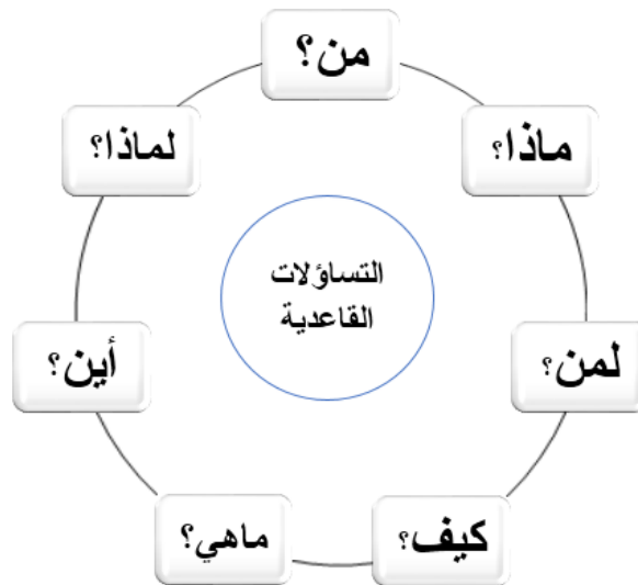
الشكل 1: الاسئلة المرجعية لبناء البرنامج الارشادي (من إعداد الباحث)

لبناء أي برنامج إرشادي لابد من وضع إجابات مقنعة للتساؤلات (الشكل 1) التي من شأن الإجابة عنها الإلمام بخصائص الفئة المستهدفة والمستوى النمائي لها، وجمع المعطيات الكافية عنها، مما يسهل وضع الأهداف الإجرائية لمختلف الجلسات، والتي تستمد من الأهداف العامة للبرنامج، وضبط محتوى النشاط المرتبط بكل هدف إجرائي، إلى جانب تحديد الأدوات، الوسائل، الاستراتيجيات، الفنيات والأساليب المساعدة على تحقيق تلك الأهداف في إطار زمني ومكاني محددين، وكذا ضبط فترات وكيفيات التقويم البنائي والنهائي والمتابعة بعد انتهاء الجلسات.