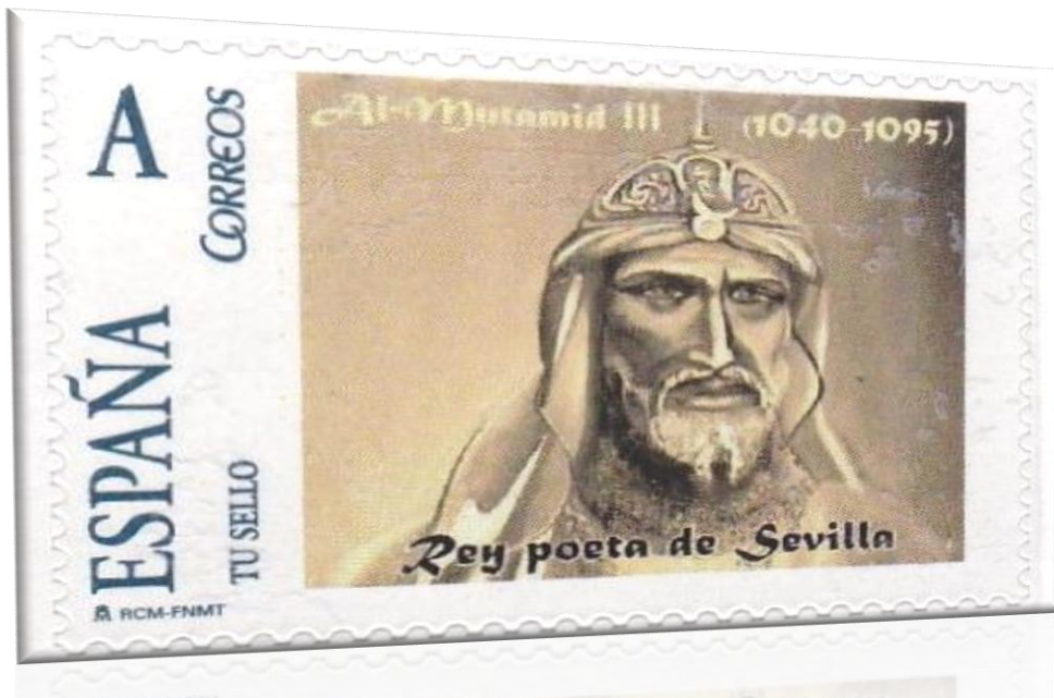
Figura núm.02: Sello conmemorativo de Al-Mu'tamid. 3