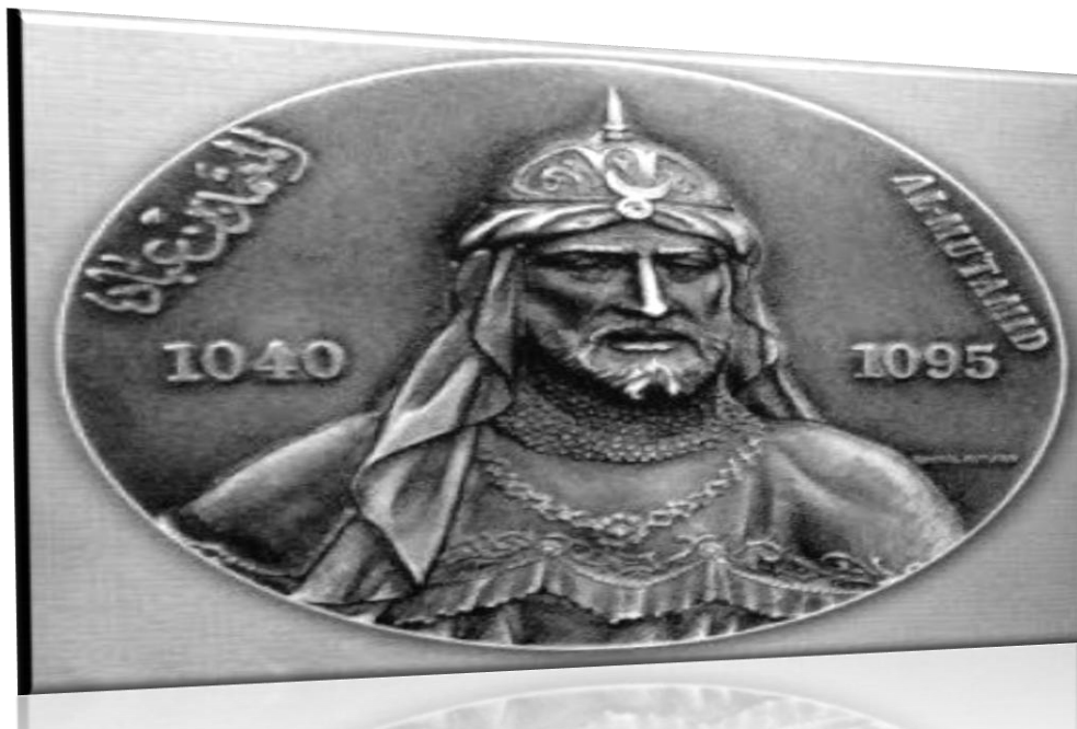
Figura núm. 03: Al-Mu'tamid. 4