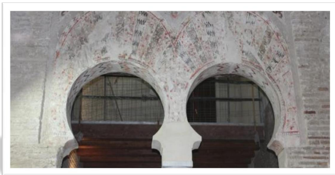
Figura núm. 01: [Beja (Portugal), 431H/nov-dic. 1039 – Aghmat (Marruecos), 488H/13 octubre 1095]. 2