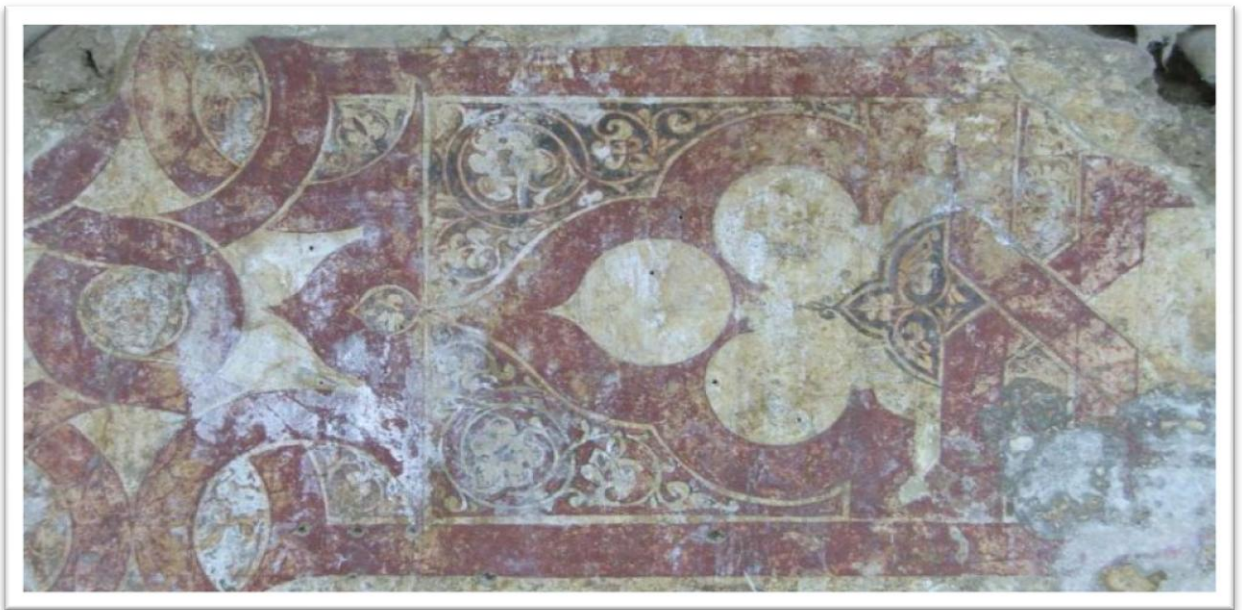
Figura núm. 07: Zócalo decorado con pinturas al fresco del periodo abadí hallados en el sótano de Hiniesta. 8