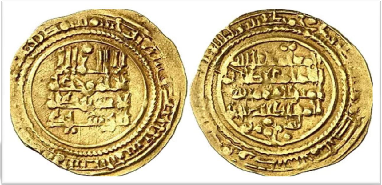
Figura núm. 06: Dinar de oro de Al-Mu'tamid del año 474H (1081). 7