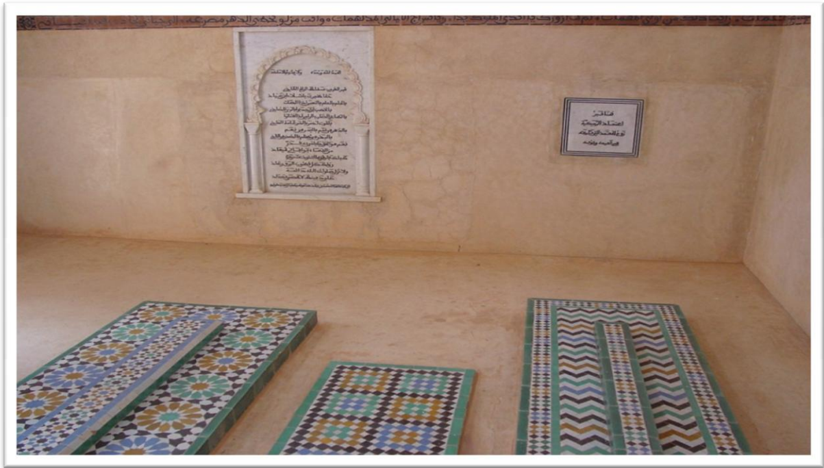
Figura núm. 04: Túmulo de Al-Mu‘tamid en Aghmat (Marruecos). 5