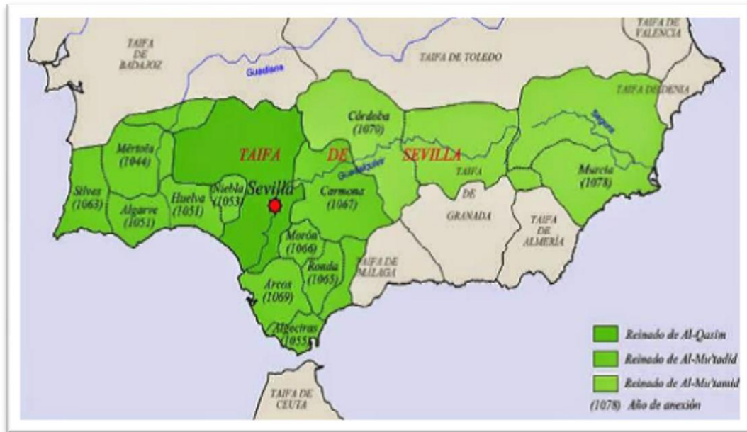
Mapa núm.01: El reino Abbādi de Sevilla y su esplendor en un extenso y poderoso reino Des de Murcia hasta Algarve, durante el periodo del cadí Abū l-Qāsim fundador de la dinastía hasta el último soberano Al-Mu‘tamid. 1