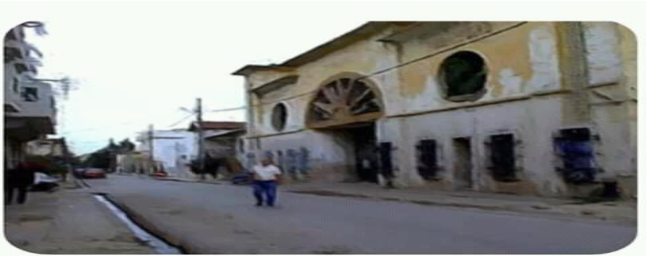
عنوان اللوحة / شارع بي بوقاريك (البلدية) القياس 50 سم / 40 سم سنة الإنجاز 2020