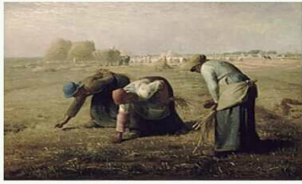
لوحة: حاصدات السنابل

لموضوعاته أكسبت أعماله عظمة تماثل ما تحظى به الموضوعات التاريخية.