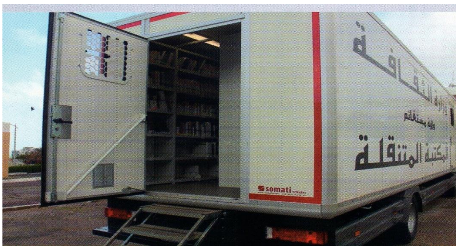
الملحق (02) المكتبة المتنقلة