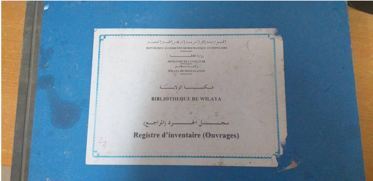
الملحق (05) سجل الجرد اليدوي