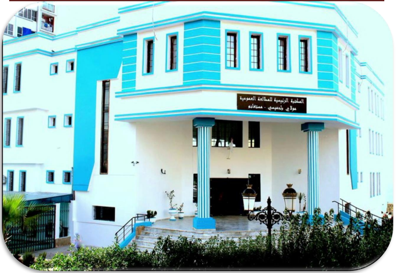
الملحق (1) صورة لواجهة المكتبة الرئيسية للمطالعة العمومية الدكتور " مولاي بلحميسي " مستغانم