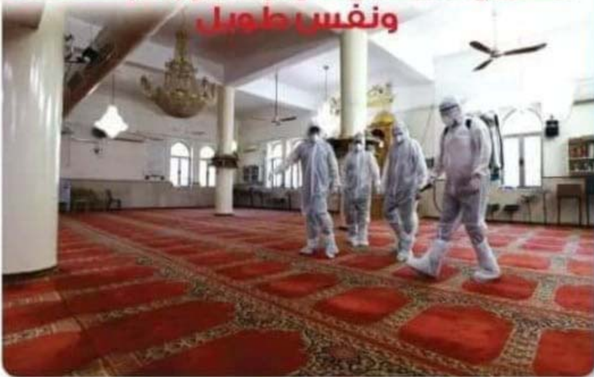
روبرتاج / محمد مرواني

انخرط جهاز الحماية المدنية بمجرد تسجيل الحالات الاولي لوباء فيروس كورونا في مواجهة مياشرة لوباء القناتك. وفي جهات مختلفة وبجهازية نوعية لاعوان الجهاز. حيث اهابت النشاطات المكثفة المنظمة من خلال الدوريات الميدانية التعسيسية العادية عن نتائج مهمة في تعبئة المواطنين تجاه التدبير التي اعلنت عنها السلطات العليا في البلاد. منها الحجر الصحي وتغادي التجمعات. وقد استعملت ”الحوار“ لتناميات وحركية مختلف مصالح جهاز الحماية بولاية مستغانم. الجهاز الذي يقوده العقيد ”يوسف عبد الحميد“. لا انشأ المسؤول الى برامج عمل مكثفة ميدانية مكيفة لمواجهة الوباء والداء الخطير. معتبر ان حسن المسؤولية والتشخيص لدى لاعوان جهاز الحماية المدنية عال ونوعي. وتوجيهات المديرية العامة والوزارة الوصية تجسدت على ارض الواقع. وحسن المواطنين بحساسية الطفرات وتطورته بفهمه لاعوان الجهاز في مختلف التدخلات الميدانية منذ ايام السلطات العمومية الى العبور الصحي وتطبيق التعليمات الخاصة التي تستوجبها محاصرة الوباء وتمايز الازمة في بعدها الصحي المتعقّب.