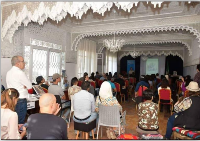
قاعة المحاضرات و التي تقام بها نشاطات المسرح