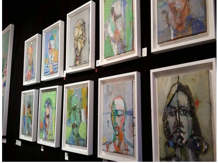
بعض من أعماله

كون كل اللوحات ذات مواضيع و أسلوب و خامة مختلفة و متنوعة زاد المعرض جمالاً، كذلك كونه وجد الدعم المعنوي القوي من العديد من عمالقة الفن، لكن شاءت الأقدار أن يكون من بين الزائرين محبين و هاوين للفن و جامعي اللوحات الفنية فأتثناء العرض جاءته عروض بيع معظم اللوحات.