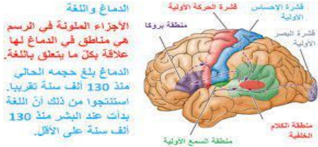
شكل رقم 1: رسم تخطيطي لمناطق اللغة في الدماغ

لقد حظيت اللغة بمحاولات عديدة لتعريفها وتحديدتها ، فأحد تعريفاتها : ■ أنها نظام يشير إلى علاقة الصوت بالمعنى ، إذ أن الهدف الواحد قد يعبر عنه بواسطة أنماط مختلفة للصوت ، ولقد أخذت تعريفات اللغة وجهات مختلفة , فنجد أن علماء اللغة يفرقون بين الكلام واللغة ن فالكلام لديهم عمل ، واللغة حدود هذا العمل ، والكلام سلوك ، واللغة ما يميز هذا السلوك ، والكلام واللغة قواعد هذا النشاط ، والكلام حركة ، واللغة نظام هذه الحركة ، والكلام يحس بالسمع نطقا والتعبير كتابة ، واللغة تفهم بالتأمل في الكلام ن فالذي نقوله أو نكتبه كلام ، والكلام الذي نحسه ونكتب بحسه لغة. فالكلام هو المنطوق والمكتوب، واللغة هي الموصوفة في كتب القواعد وفقه اللغة والمعجم ونحوها، والكلام قد يحدث أن يكون فرديا، ولكن اللغة لا تكون إلا اجتماعيا. (زينب محمود شقير 2001-ص19-18)