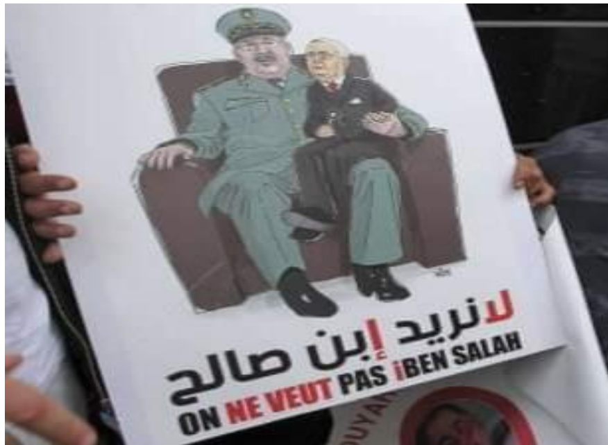
12/12/2019. Argel. . لا نريد ابن صالح . On ne veut pas iben Salah