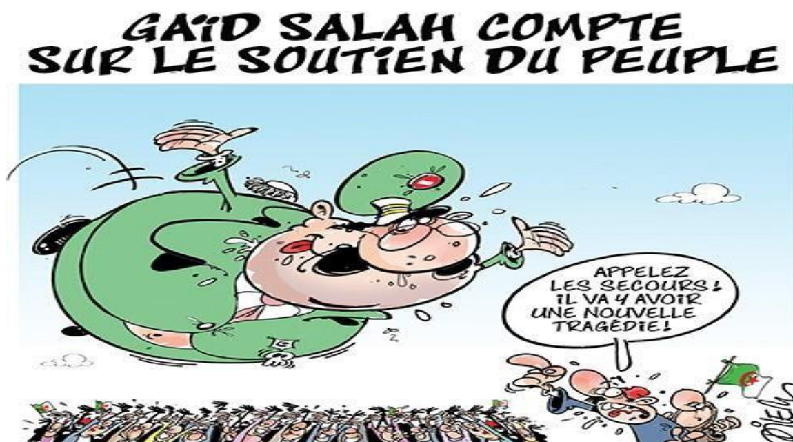
Liberté 25/4/2019: Dilem