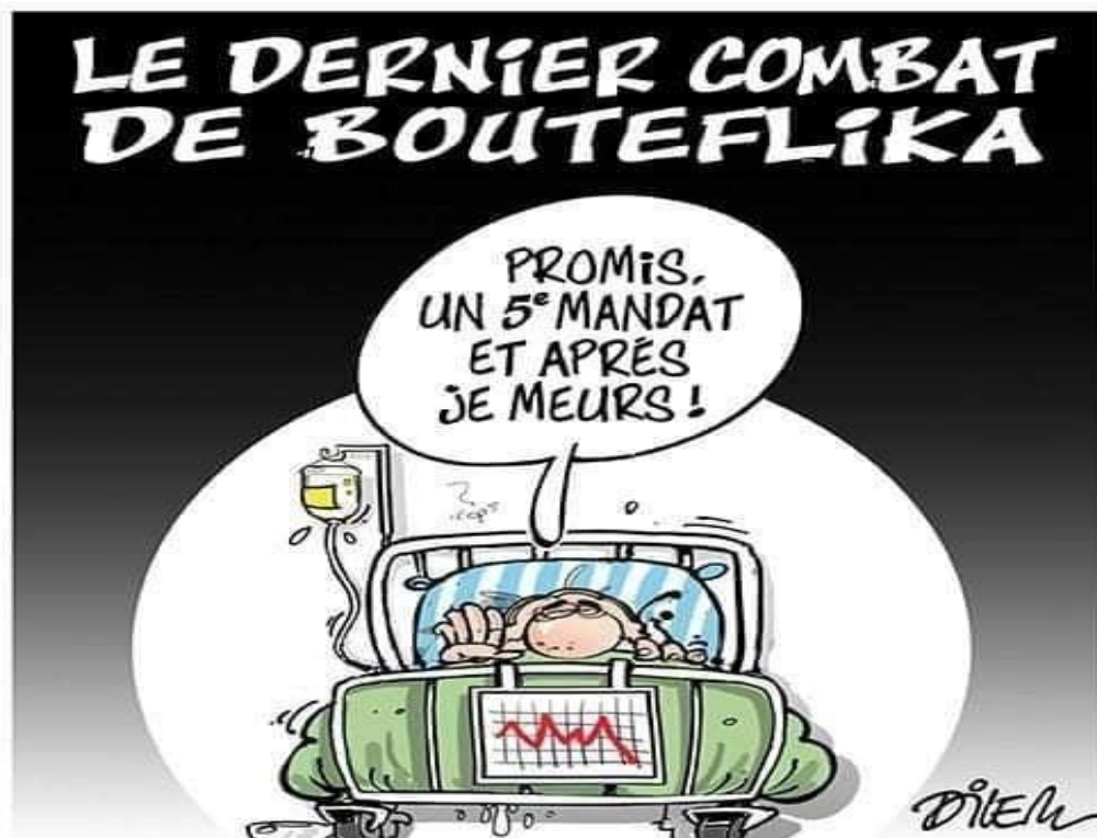
Ali Dilem 6/3/2019 – liberté. Le dernier combat de Bouteflika.