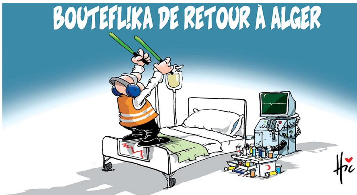
El watan 10/3/2019: le hic