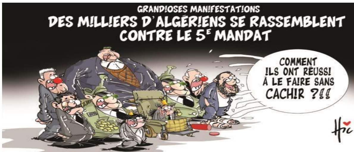
El watan 23/2/2019 : lehic