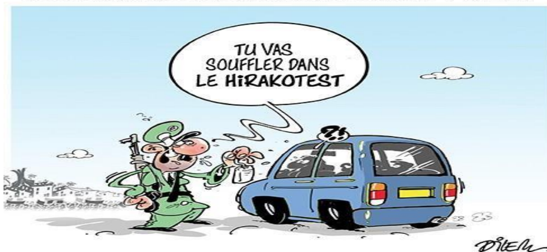
Liberté 28/4/2019: Dilem