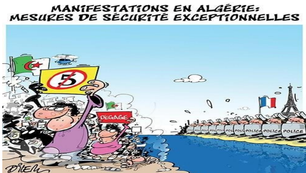
Liberté 28/2/2019 : Dilem