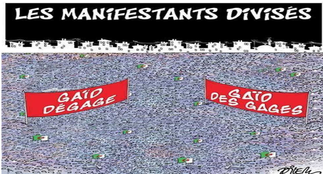
Liberté 27/4/2019. Dilem