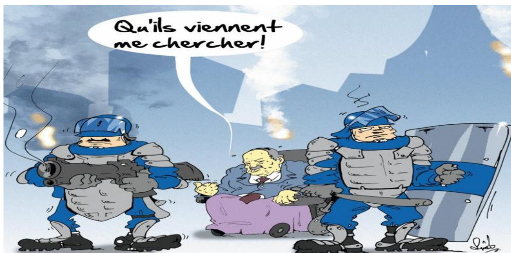
El watan 04/03/2019: Sàad