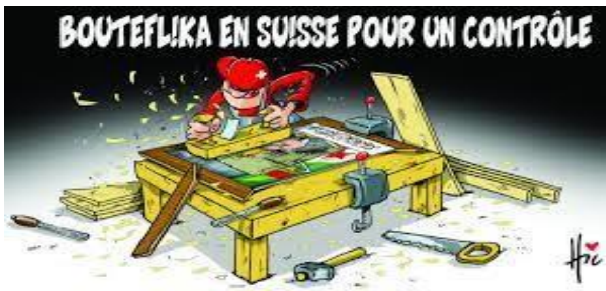
El watan23/2/2019: le hic