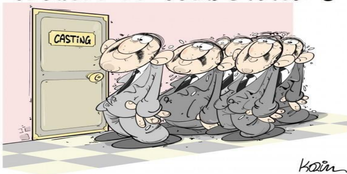
Le soir 13/3/2019: Karim