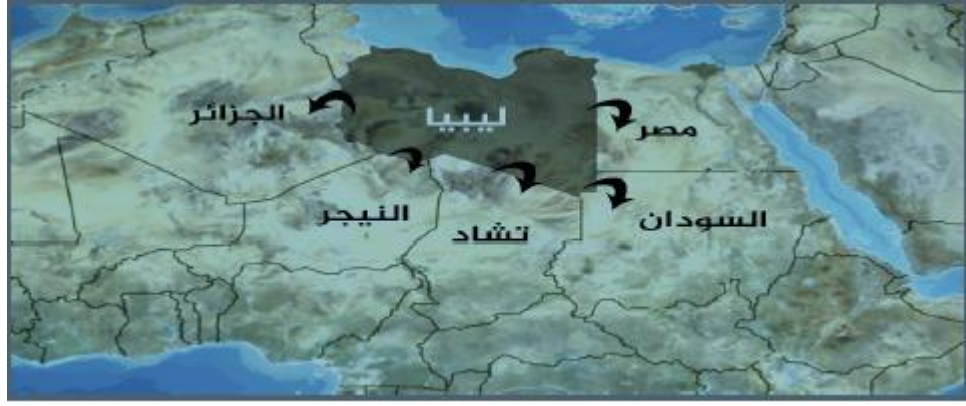
الخريطة (5): مركز الجزيرة للدراسات الدوحة

http://studies.aljazeera.net/ResourceGallery/media/Documents/2014/12/11/20141211103135707580Algeria-new-security