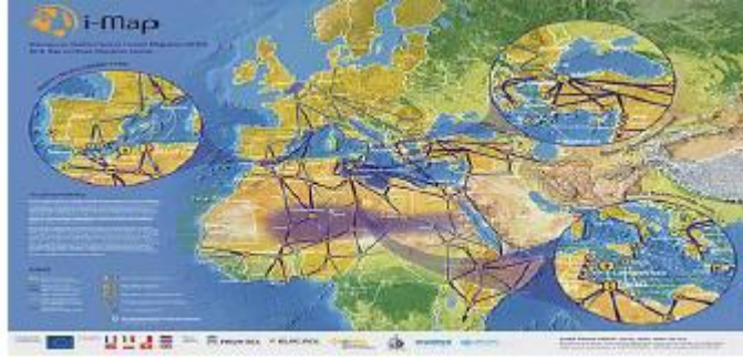
الخريطة(4) توضح خطوط الهجرة من الجنوب الى الشمال

47= http://www.imap-migration.org/index.php?id