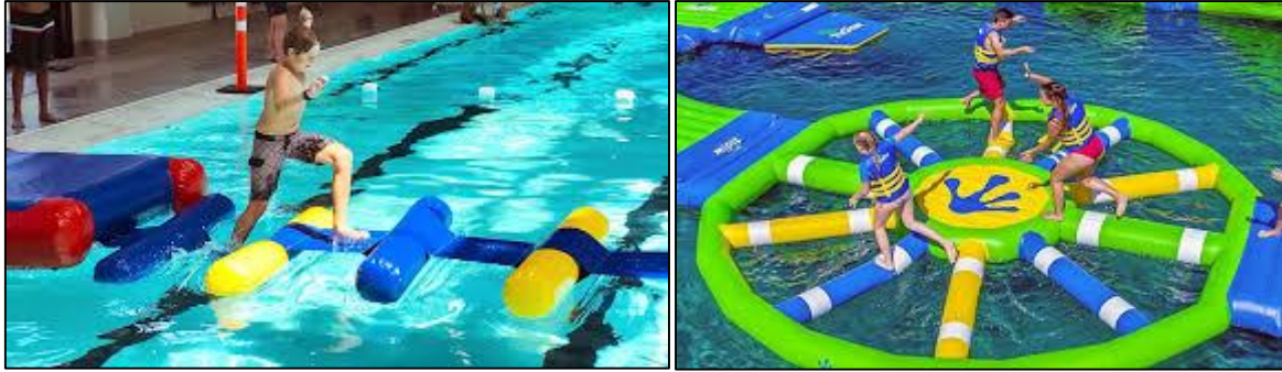
الشكل رقم (06): حديقة عائمة

تتكون هذه الحديقة من ألعاب مائية قابلة للنفخ ومناسبة لجميع الأعمار يمكن ممارستها في البحر او المسبح او البرك المائية.