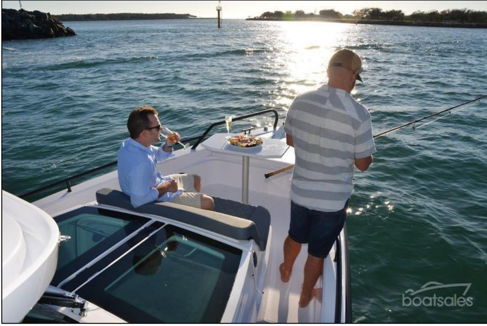
الشكل رقم (07): خرجات صيد من فوق القارب (pêche sportive)

8-3-3. دروس و خرجات الغوص بالمعدات (plongée avec bouteille)