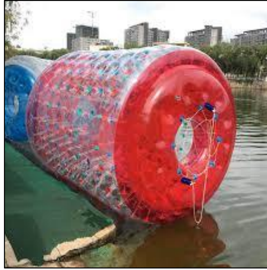
الشكل رقم م(03): الكرة الهوائية (Zorbing)