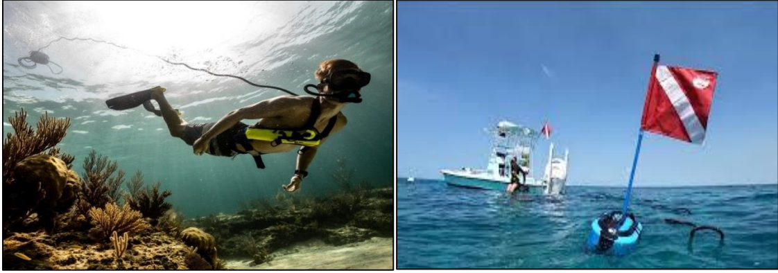
الشكل رقم (02): الغوص بدون قارورة (tanklessdiving)

يعتبر هذا النوع الجديد المبتكر من طرق الغوص الحديثة التي تلقى رواجاً كبيراً مؤخراً لسهولة استعمالها . و مزايا اخره كصغر حجمها و خفة وزنها . و كذلك سهولة تعبئتها و إعادة استخدامها بعد كل خرجة .