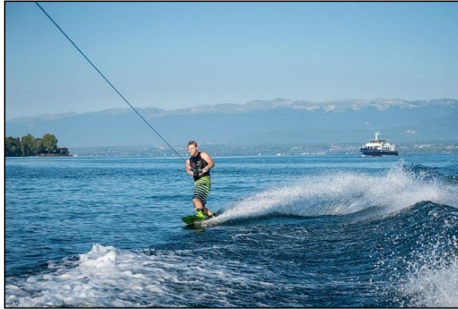
الشكل رقم (01): Wakeboarding