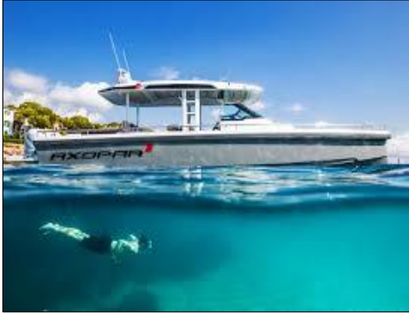
الشكل رقم (05): عملية الغوص الحر