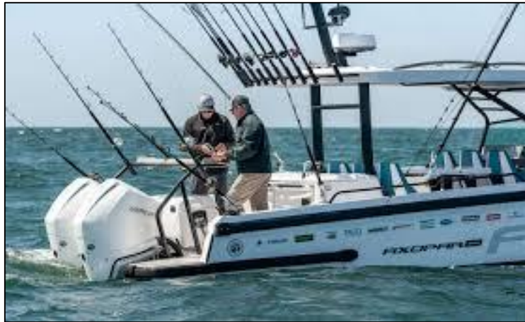
الشكل رقم (04): صيد الأسماك الرياضي بالقصبة من القارب