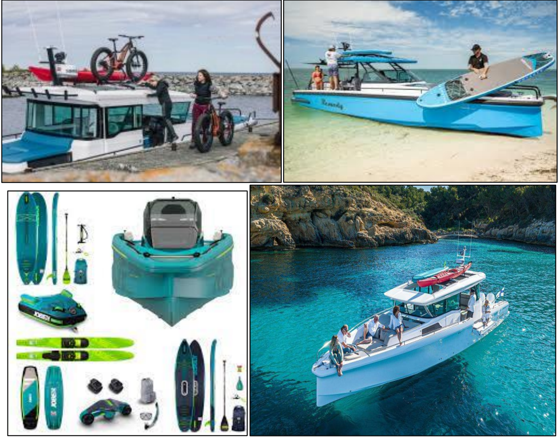
الشكل رقم (10):