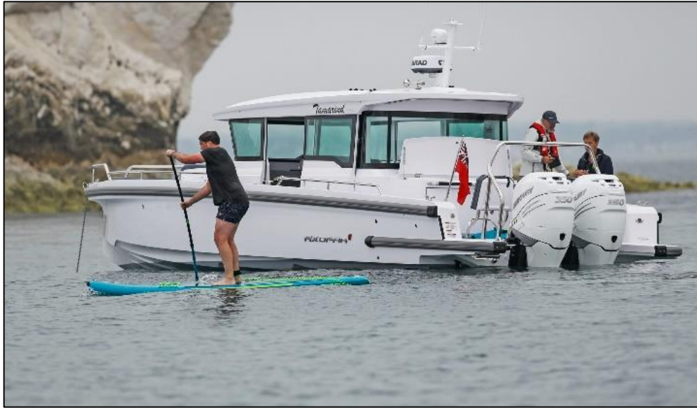
الشكل رقم (08): يبين عملية تعلم التجديف