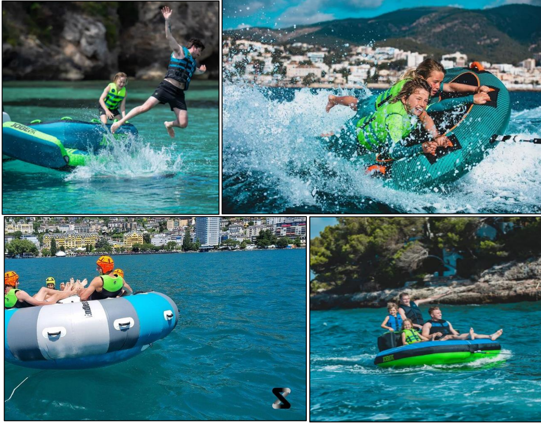
الشكل رقم (09):