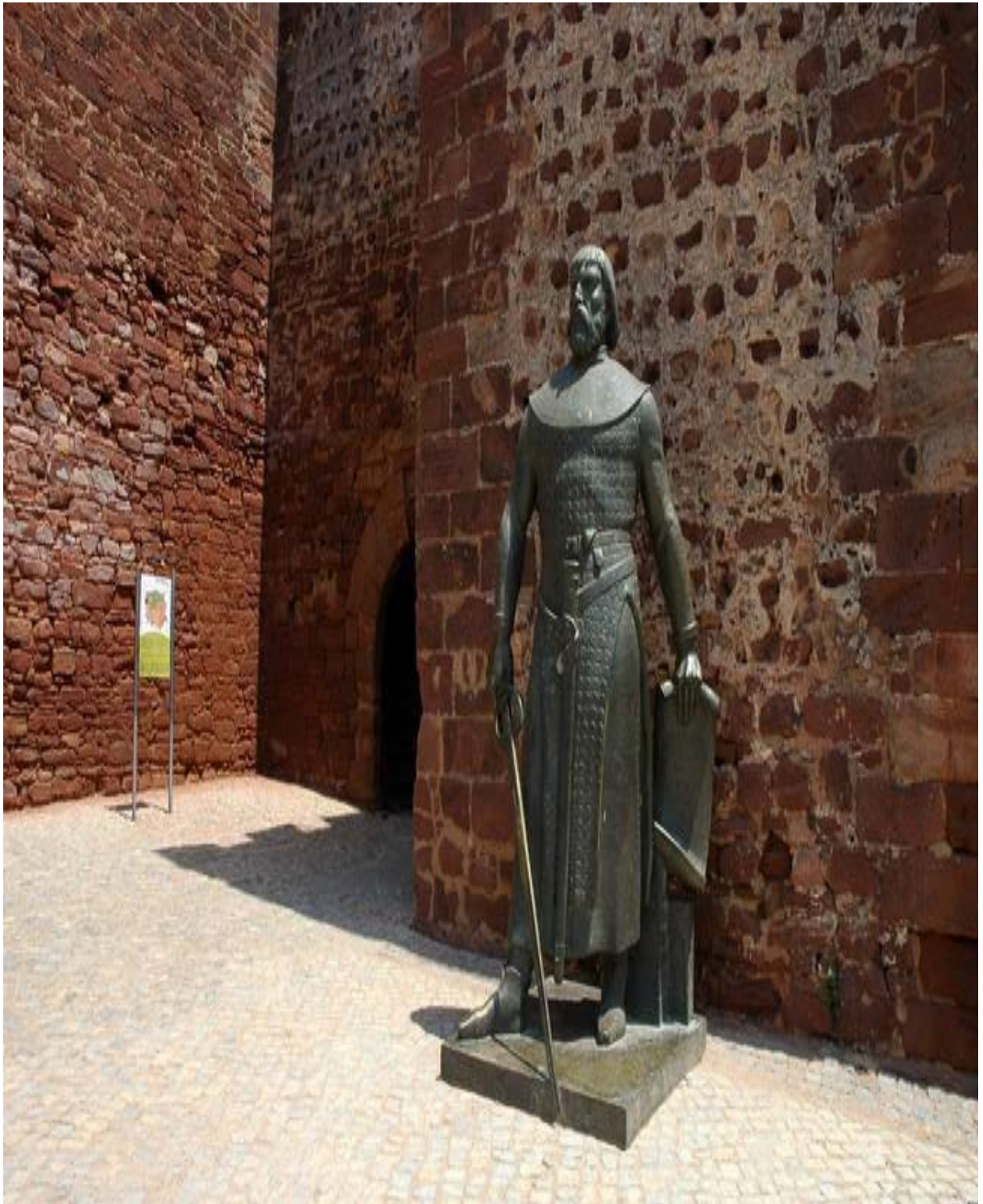
Figura número 5: Castillo de Silves en Portugal.

Disponible en: https://support.google.com [Consultado el 29 de Mayo de 2023].