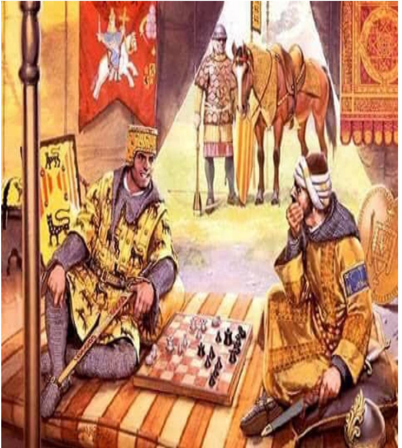
Figura número: representa la partida de ajedrez entre el rey Alfonso VI y el visir ibn 'Ammār de silves

Disponible en: https://www.google.com ,[Consultado el 29 de Mayo de 2023].