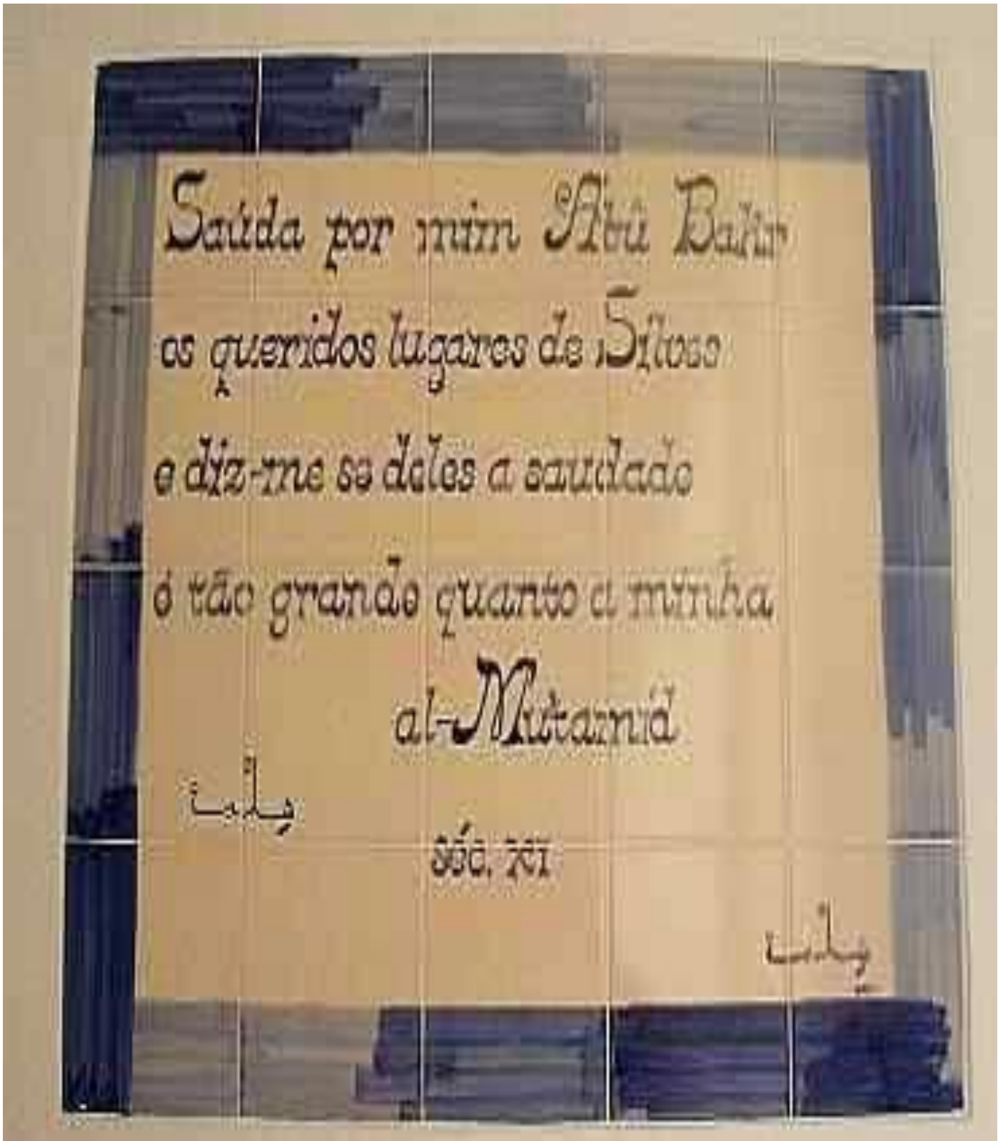
Figura número 1: representa un unos versos escritos por al-Mu‘tamid a su amigo ibn ‘Ammār.