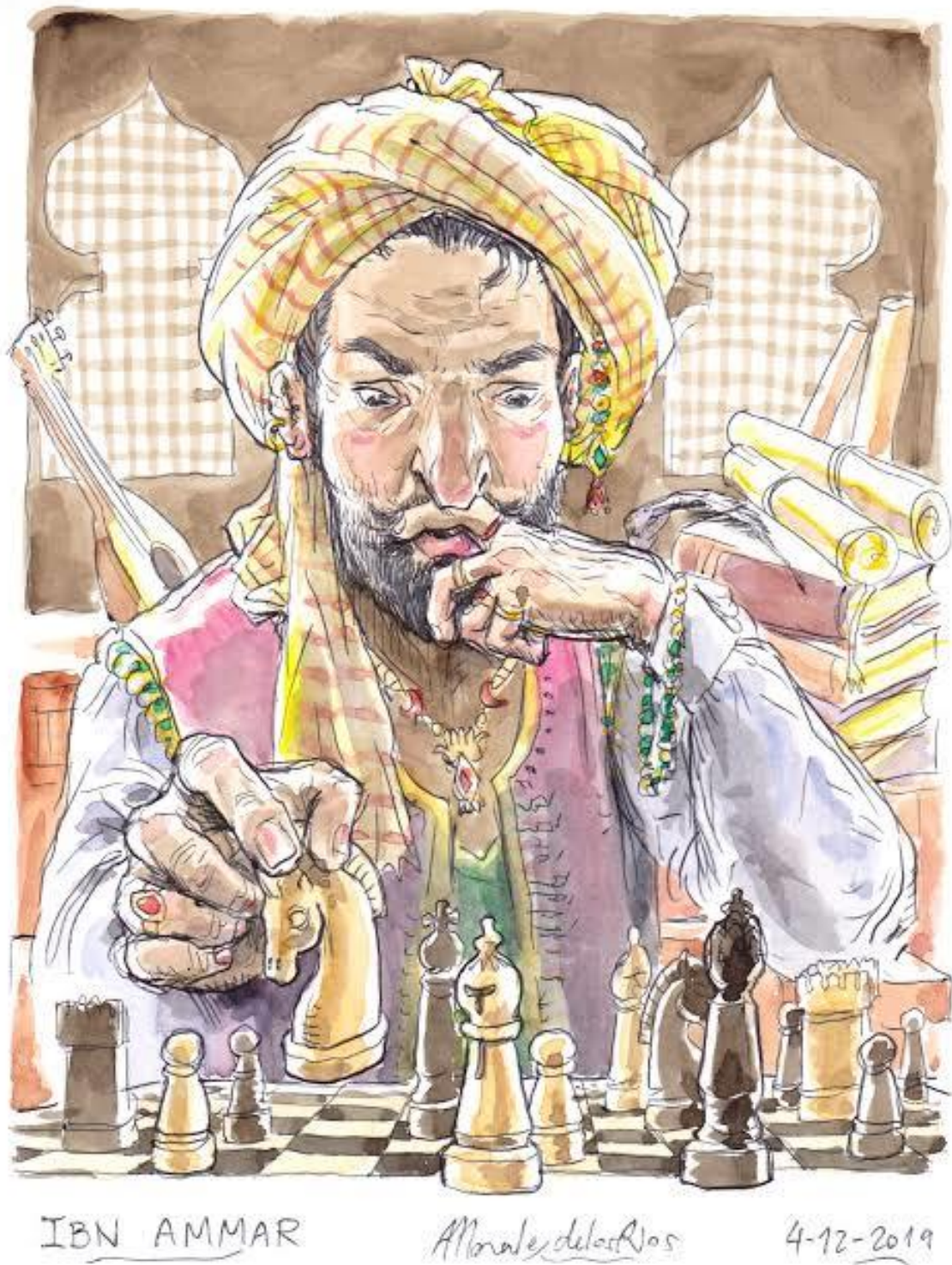
Figura número 4: retrato de ibn 'Ammār al- Andalusí y la partida de ajedrez.

Disponible en: https://www.google.com/search , [Consultado el 10 de Mayo de 2023].