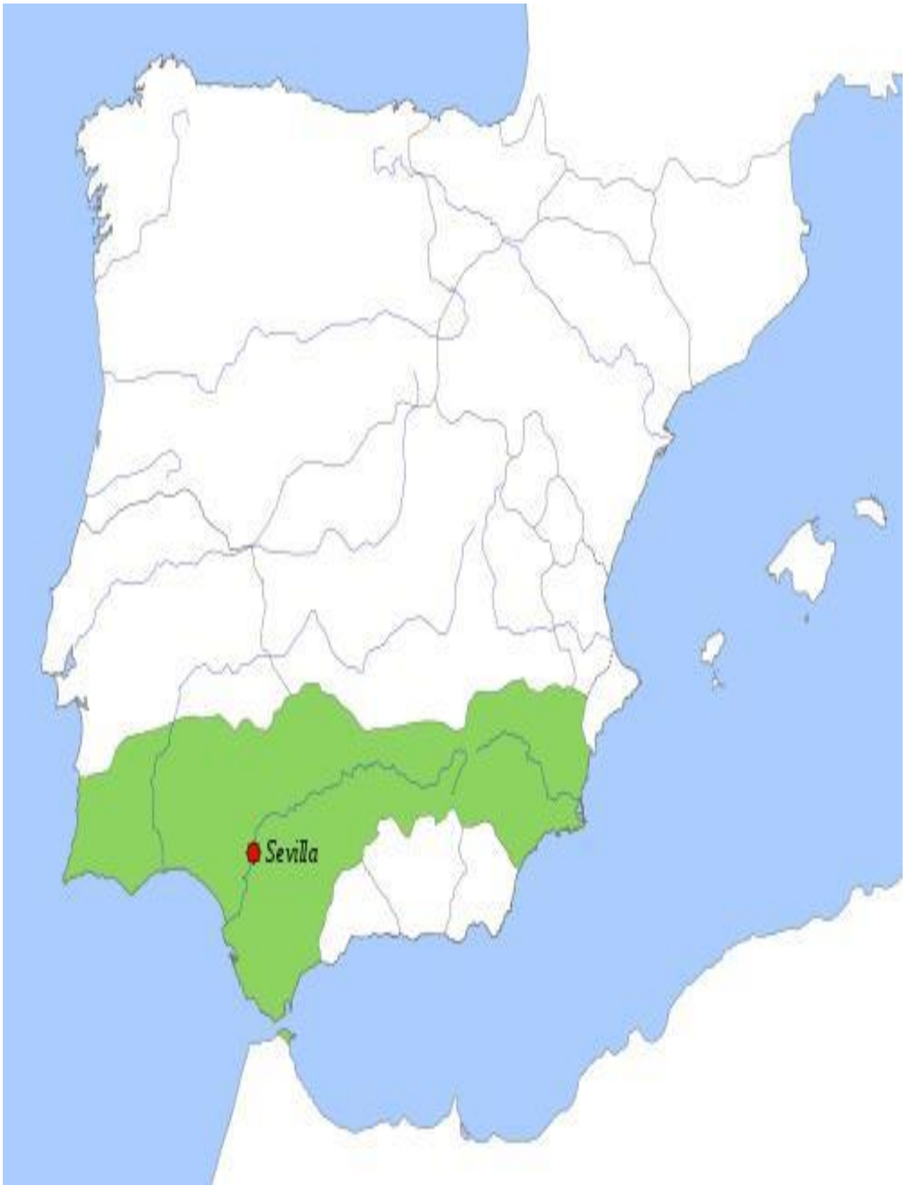
Figura número3: mapa de la expansión territorial de la taifa Sevillana en siglo XI

Disponible en: https://www.google.com [Consultado el 10 de Mayo de 2023].