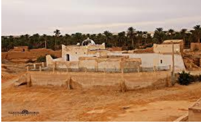
الشكل رقم: 03