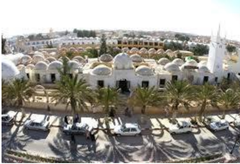
الشكل رقم: 01

صورة تمثل الشارع الرئيسي لمدينة وادي سوف