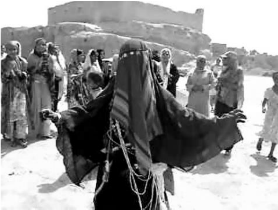
صورة 05: عروس ترتدي لباس "الباخمار"

علي بن عثمان" حيث يوجد الجامع وبه غرفة خاصة للعروسة وأهلها يتم فيها الإلباس، ففي تقاليد لبس "الباخمار" لا تكشف العروسة وجهها حتى ليلة الدخلة وهذا ليبقى "مستتيرا"، لكن قبل هذا يتم تحضير "الطبق" وفيه الكحل، العطور، البخور، اللبان، حبة رمان و برتقال مع الحناء (حناء مطحونة). كما يتم تحضير "قرعة" (او يقطينة) بها عشبة "الدور"، قشور البرتقال، حناء (عشب) والقليل من الماء والكل يوضع في قطعة قماش داخل هذه القرعة حتى يتم الحصول على مادة عطرة يرش بها العروسة ومن بصحبتها وكذا الولي.