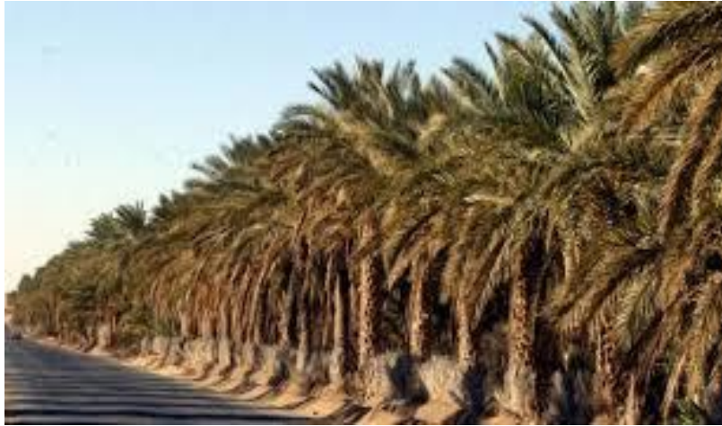
الشكل رقم: 04