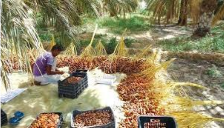
الشكل رقم: 06