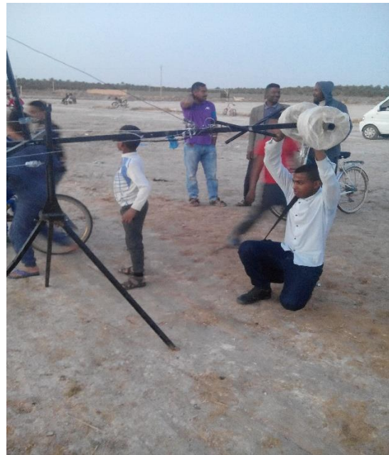
الشكل رقم: 11