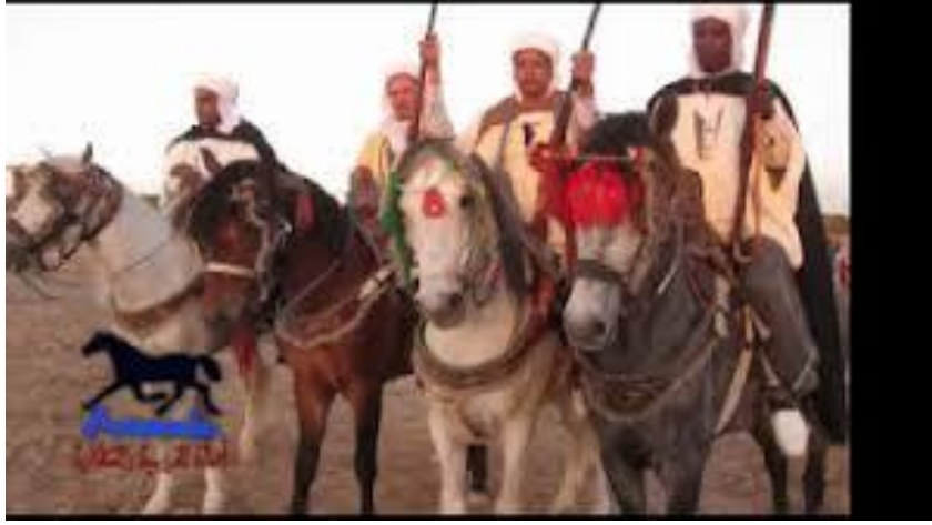
الشكل رقم: 07

صورة تمثل جانب من الفلكلور الشعبي (الفروسية)