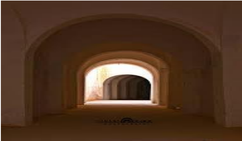
الشكل رقم: 02

صورة تمثل الشارع الرئيسي لمدينة وادي سوف