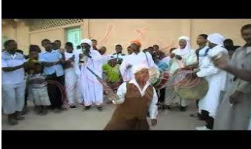
الشكل رقم: 08

صورة تمثل جانب من الفلكلور الشعبي (الفروسية)