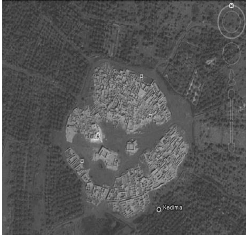
. صورة 01: قصر "تمرنة من القمر الصناعي

التاريخ كما تدل على ذلك هندسته المعمارية المبنية من الطوب وجريد النخيل، ومواده كلها محلية. تداخل البيوت، المسارات، الالتواءات والمضايق في الطرقات، كلها هندسة جعلت الكثيرين يهتمون بهذا العمران الصحراوي لما له من قيمة أثرية وحتى سياحية.