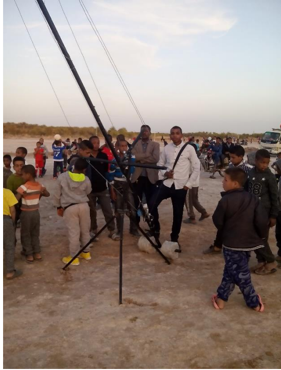
الشكل رقم: 10