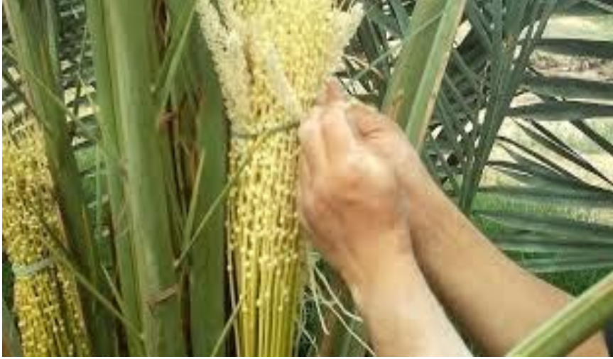
الشكل رقم: 05