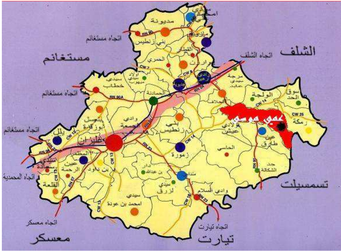
خريطة تبرز موقع عمي موسى بولاية غليزان

من الشرق بلدية الرمكة والسوق الحد ويقع مقر البلدية بالقسم الغربي منها في نقطة تلاقي الطريق الوطني رقم 90 والطريق الولائي رقم 14 وترتفع بعلو قدره 150 متر على سطح البحر تتميز بلدية عمي موسى بسلسلة جبالها التي تنتمي الى سلسلة جبال الونشريس