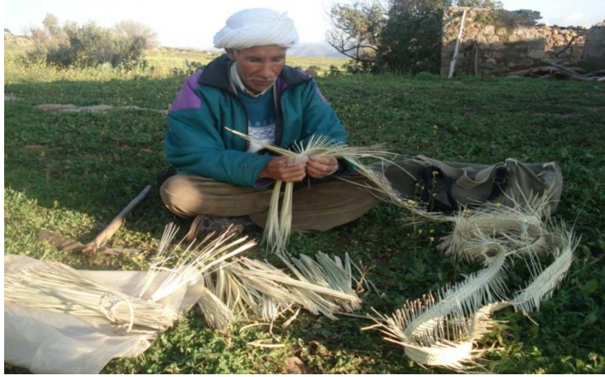
صورة لصناعة الحصير والقبعات بالدوم

أولاً/الصناعة التقليدية: في مجال الحرف اليدوية تتميز البلدية بصناعة النسيج "الزربية"، الملابس النسائية و الرجالية ، صناعة الحصير ، السلال ، المراوح، القبعات باستخدام الدم ، صناعة الاواني الفخارية .