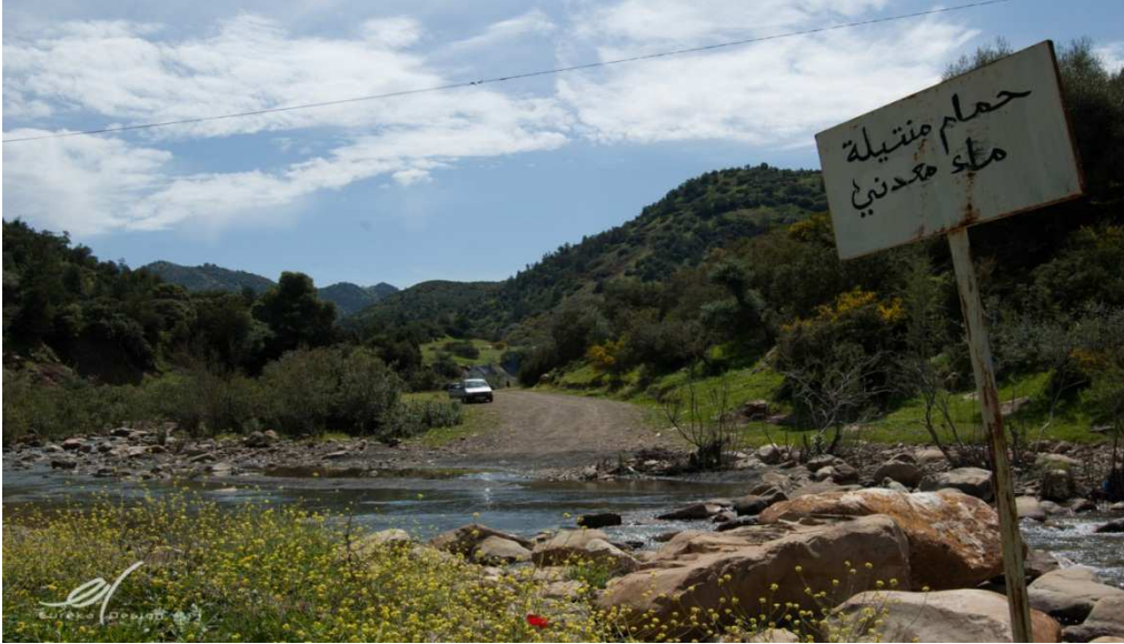
صورة لحمام منتيلة

رابع/الامكانات الحموية 1 : المعالجة بالمياه الحموية واحدة من النقاط القوة لتطوير السياحة الحموية و تنشيط المنطقة السياحية بالمنطقة التي تملك حمام منتيلة 31 درجة مئوية مياهه ذات خصائص علاجية معترف بها والذي استفاد من دراسة تهيئة نظرا لخصائصه العلاجية الفريدة من نوعها.