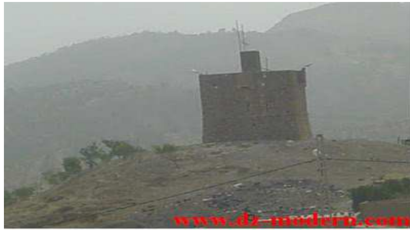
صورة برج المراقبة

ثانيا/المعالم الدينية و المواقع الروحية: