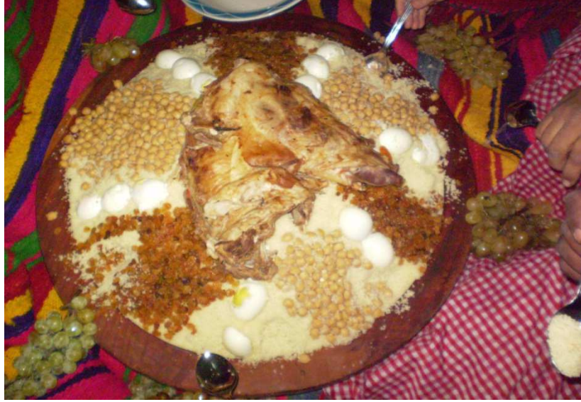
صورة لأكلات تقليدية

ثانيا/الأكلات التقليدية : من اشهر الاطباق الحريرة و الكسكى و المسفوف و الدوارة و العصبان و البركوكس و الرفيس و الملطوع و الخمير و الرقاق .