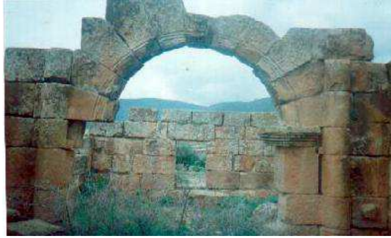
صورة قصر كاوة