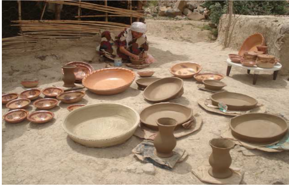
صورة لصناعة الاواني الفخارية