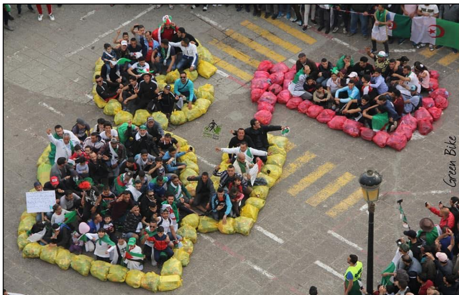
Figure 3 : Le balayage des rues afin de donner une image d'une campagne de communication positive

Les initiatives élaborées par les artistes peintre sont apparus dans quelques wilayas à Blida, Alger et Bejaia.