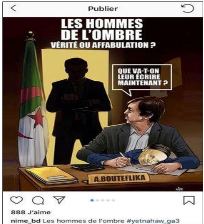
Figure 1 : Publication sur le compte Instagram officiel de Nime Bd

Son arrestation au mois de Décembre 2019 s'est prononcée, suite aux multiples publications Facebook sur sa page qui ne laissera pas ses fans indifférent.