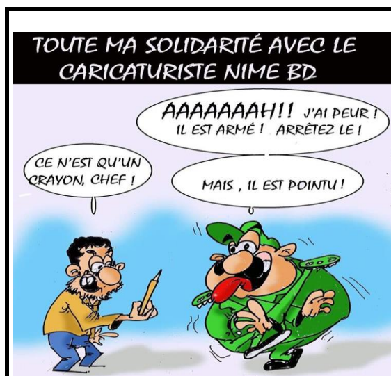
Figure 2 Caricaturiste algérien solidaire avec Nime.

Donc, ce qui est implicite n'est pas dit ouvertement, n'est pas exprimé expressément, formellement.