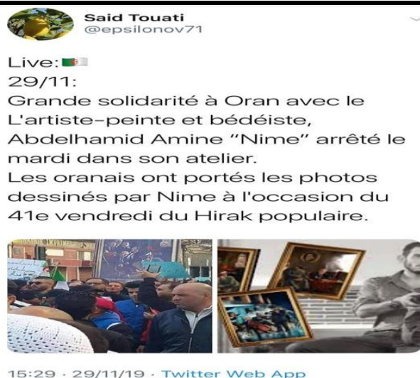
Figure 3 : Publication Twitter en solidarité avec Nime.