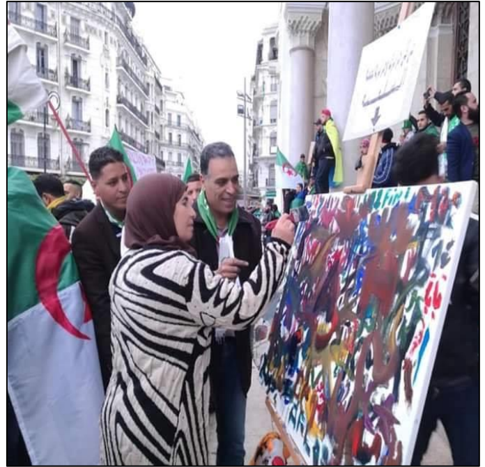
Figure 1 : place d'Abdelkader à Alger un peintre dépose sa toile et invite les manifestants à dessiner, colorier, écrire.

Dont laquelle les manifestants ont pu librement y prêter main forte.