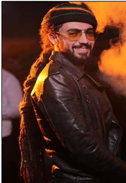
Figure 5 : Djam Chanteur Regga Algérien dans le rôle de chant en faveur du hirak