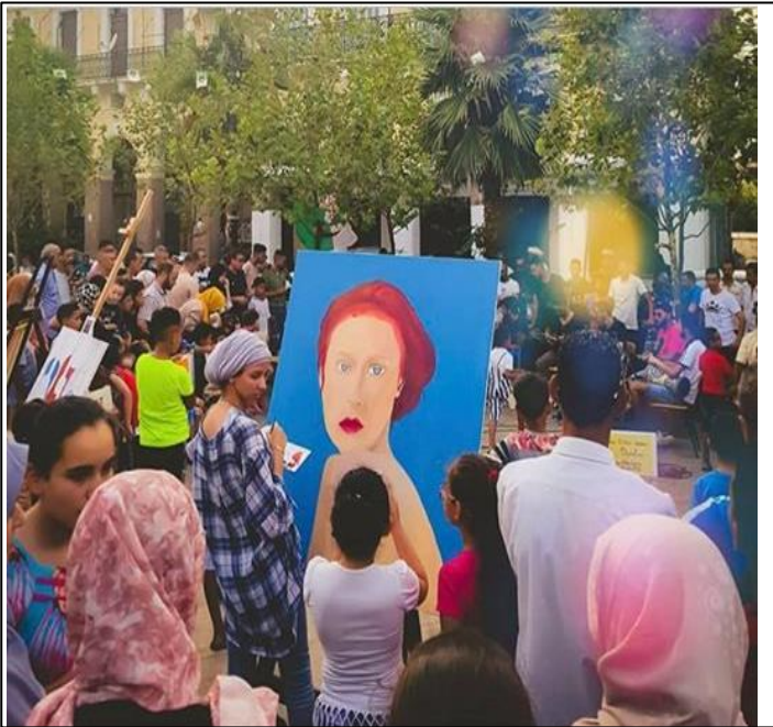
Figure 2 : le regroupement des artistes peintre dans une des rues de Blida incitant les personnes à les rejoindre dans le but d'ouvrir l'espace culturel à Blida.

Cette touche esthétique lors des marches comme nous le montre les figures suivantes :