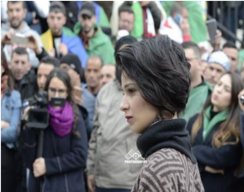
Image 03 : Séquence du personnage L'cachiri avocate de Nidham face au témoignage du jeune