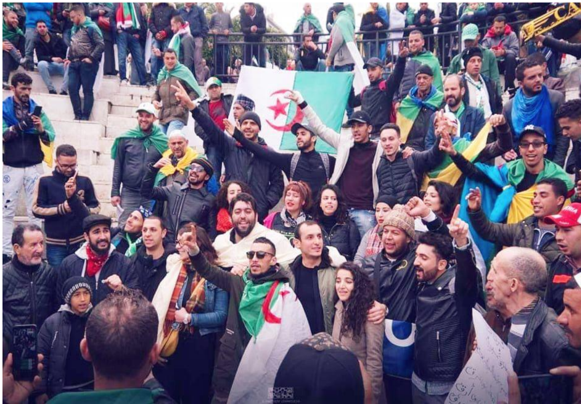
Image 10 : Dernière Séquence Fin du spectacle les personnages saluent le public et les rejoint pour la marche.