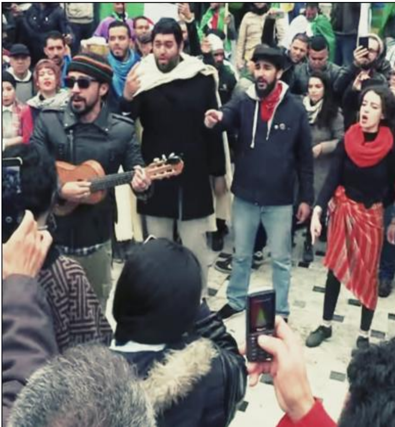
Image 09 : Séquence du chant patriotique de l'artiste Djam ainsi que le reste du groupe.