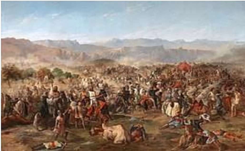
Nº 3 La batalla de las Navas de Tolosa