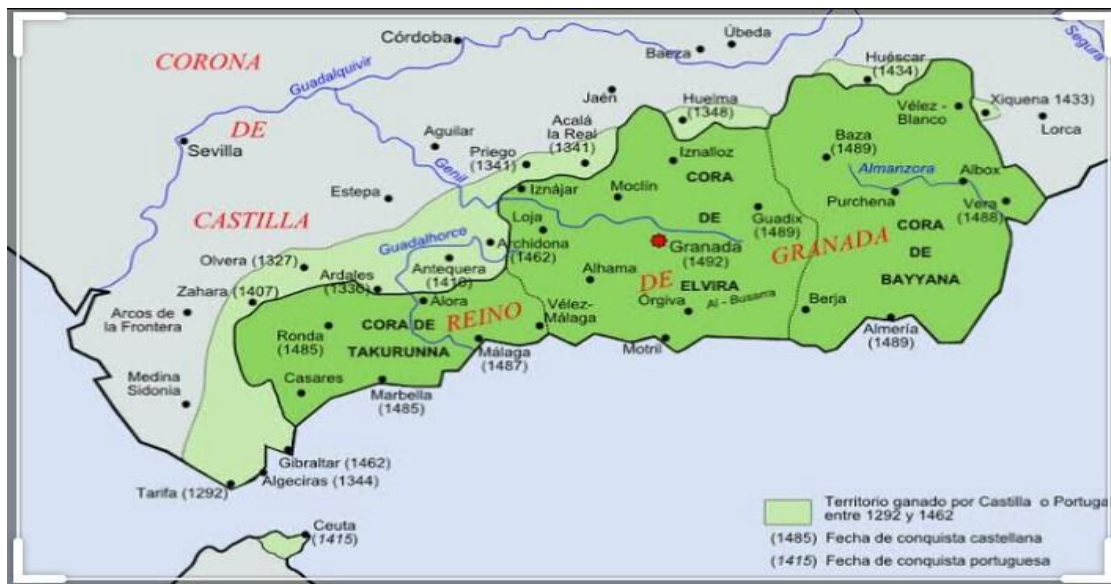
Nº 4 El reino Nazarí de Granada