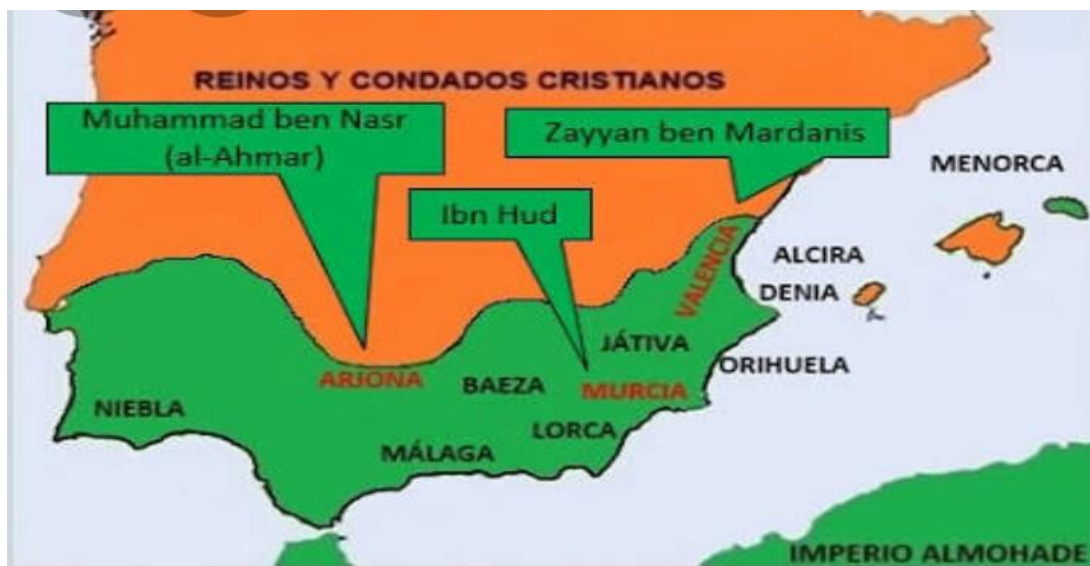
Nº 2 El periodo de terceros reinos de taifas