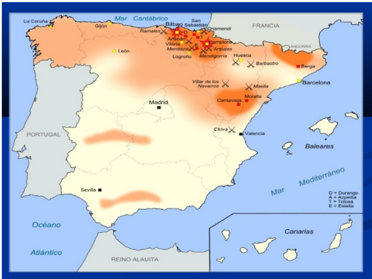
Mapa que se presenta la evolución de la primera guerra carlista y las zonas más afectadas (1833-1840) 3