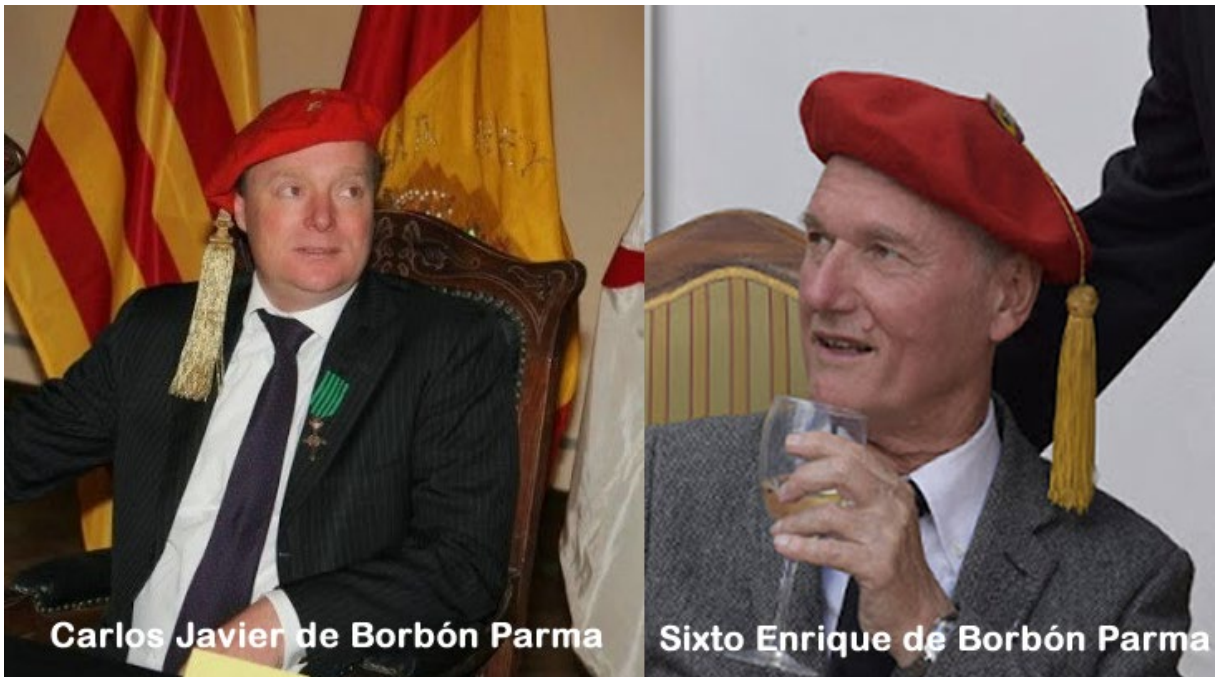
Don Enrique Sixto de Borbón y Carlos Javier de Borbón y Parma el hijo de Carlos Hugo, los pretendientes actuales de la dinastía carlista.