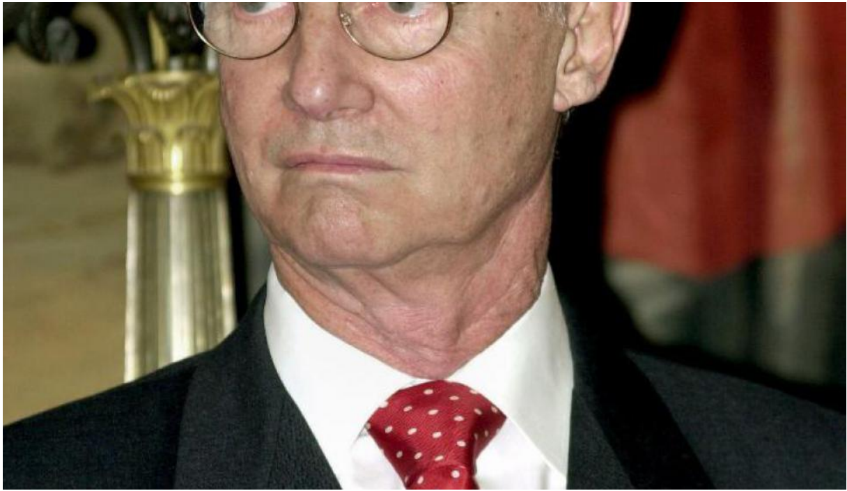
El príncipe socialista Carlos Hugo de Borbón y Parma (1930- 2010).