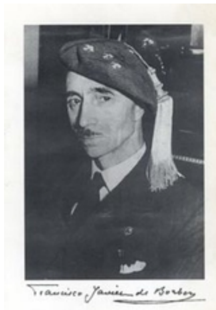
El príncipe Francesco Javier de Borbón – Parma y Braganza (1889- 1977)