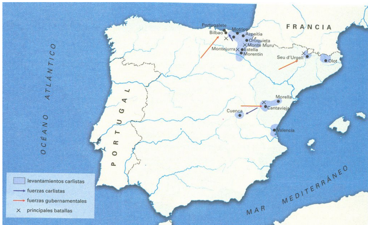
Mapa que representa las principales batallas de la segunda guerra Carlista (1872-1876) 4