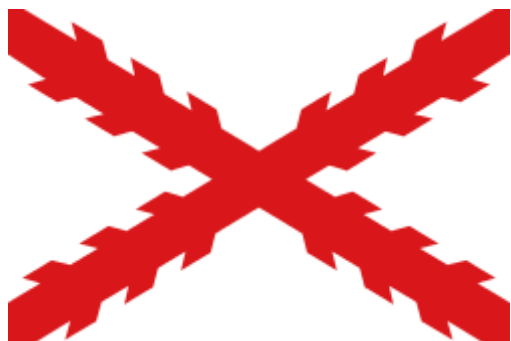
La bandera de San Andrés de la dinastía Carlita.

El árbol genealógico de los reyes de España que divide los Borbones reyes actuales de España y los pretendientes Carlitas 1