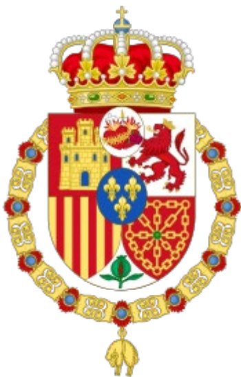
El escudo real de la dinastía carlista de la actualidad desde la regencia de Don Javier.