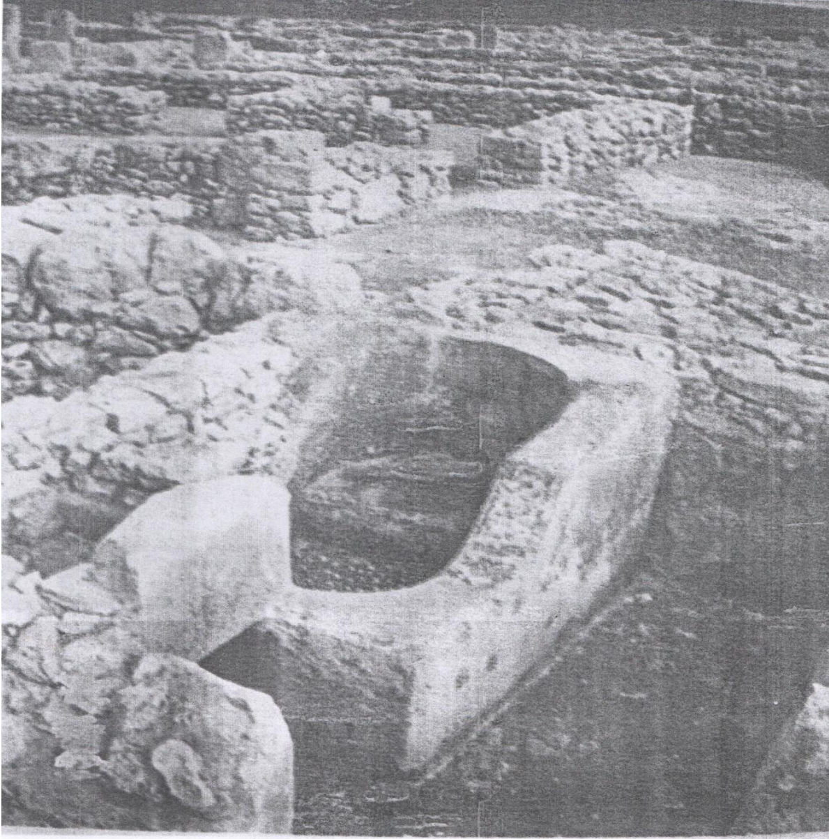
صورة رقم (01): موقع قرقوان بتونس 1

وبنى الرومان في كل بلاد حلوا بها حمامات جماعية كانت تستخدم للتدليك والعناية بالجسم والبشرة خاصة. و نظرا لتواجد الرومان المطول في الجزائر وتوفر كل أرجائها على ثروة مائية هائلة، فقد انتشرت الحمامات التي كانت ملكيتها تعود إلى الدولة و" أصبحت الحمامات مكانا يجمع بين ملاء الفراغ ومنتعة الاستحمام". 2 إذ كان الرومان يهتمون كثيرا بالاستحمام ويعود ذلك إلى تقاليدهم القديمة جدا والعائدة في أصولها الأولى إلى عهد