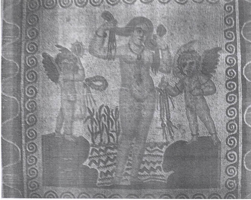
صورة رقم (02): فسيفاء رومانية تصور الآلهة فينوس داخل حمامها 1

الوثنية، التي اقترنت بعبادات خاصة، حيث كان الماء يمثل في معتقداتهم رمز الطهر ويستخدم لحماية المنازل. و لشغف الرومان بالحمامات جسدها حتى في لوحاتهم. وتبرز الصورة التالية فسيفاء رومانية تصور الآلهة فينوس داخل حمامها.