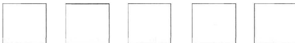
Schéma de l'environnement de la tâche de préparation (deuxième production écrite)