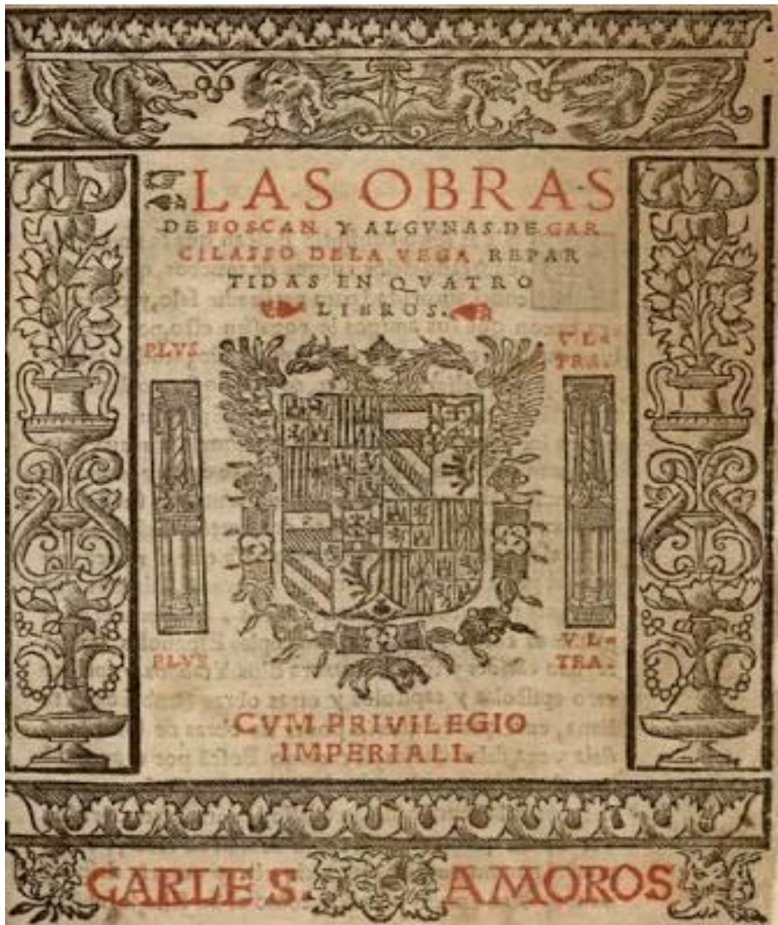
Anexo 1: portada de los poemas de Garcilaso de la Vega disponible en https://images.app.goo.gl/eYTqCbzhSmk5sthk7