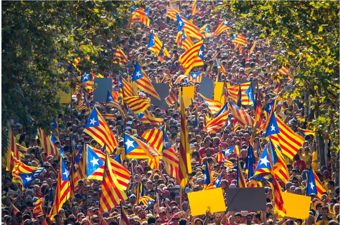
Figura N°6. Foto que demuestra la multitud de personas durante el 11 de septiembre que es el día de fiesta nacional de Cataluña

https://www.google.com/search?q=la+fiesta+de+catalu%C3%B1a+e+11+septiembre&rlz=1C1NDCM_fiDZ821DZ821&sxsrf=ALeKk02rNL26B68gAU2uJ3BAza7ct5SL2A:1593243298749&source=lnms&tbm=isch&sa=X&ved=2ahUKEwjU_fLmvaHqAhWtBWMBHX3mAtUQ_AUoAXoECA4QAw&biw=1366&bih=608#imgrc=lbu0oxFdzoX_wM