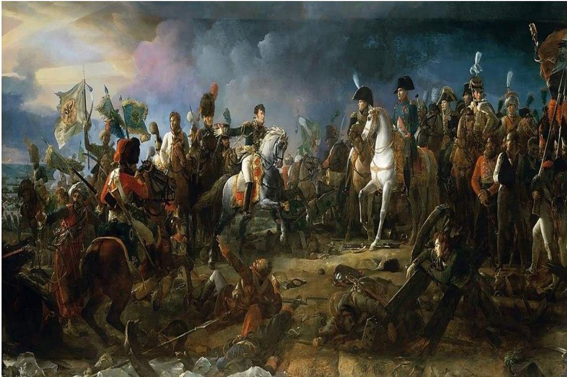
Figura N°1 Las guerras napoleónicas, también llamadas guerras de la Coalición, 2 fueron una serie de conflictos bélicos que tuvieron lugar durante el tiempo en que el emperador Napoleón I Bonaparte gobernó en Francia

https://es.wikipedia.org/wiki/Guerras_napole%C3%B3nicas#/media/Archivo:La_bataille_d'Austerlitz._2_decembre_1805_(Fran%C3%A7ois_G%C3%A9rard).jpg