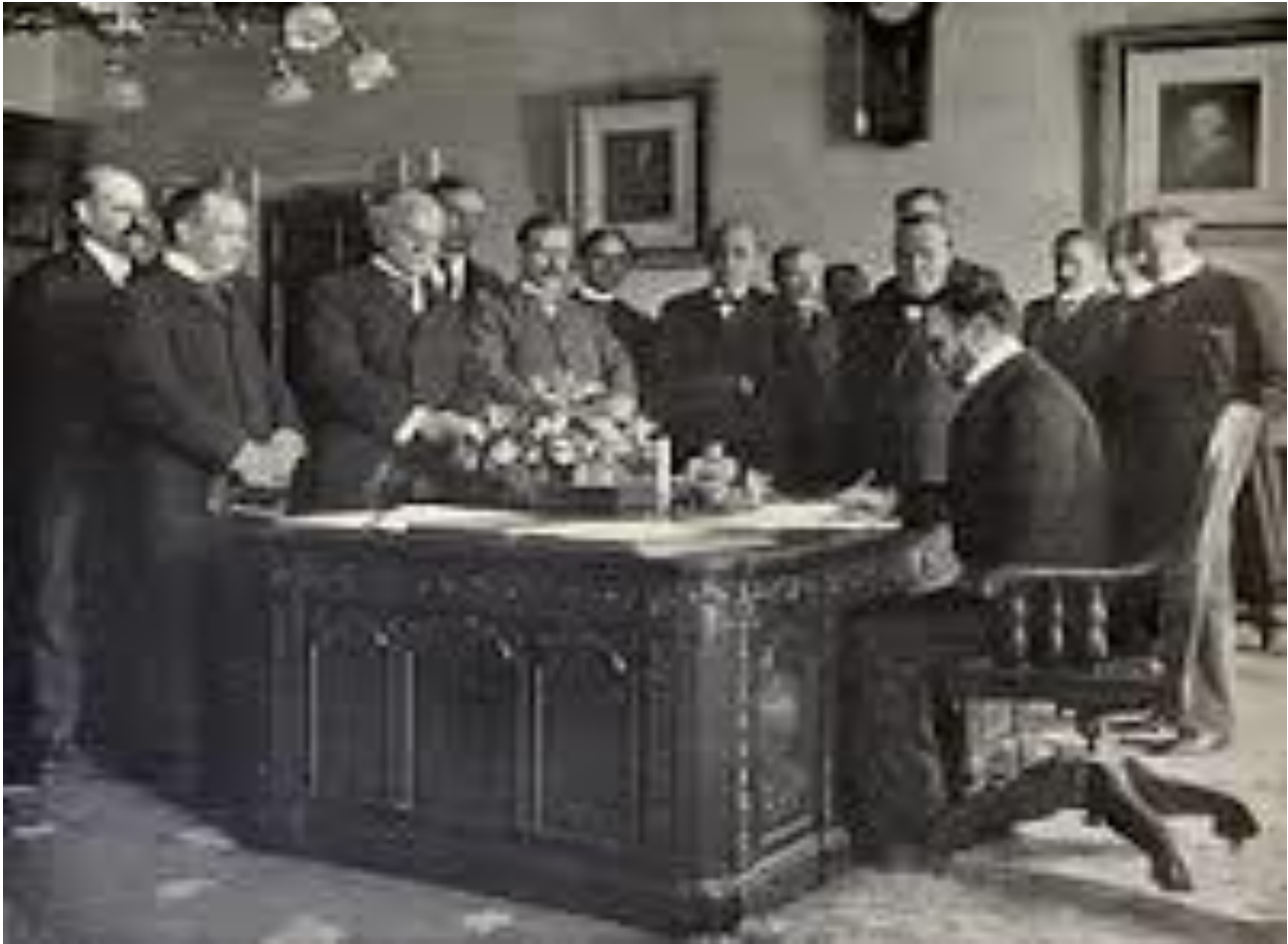
Figura N°2 Tratado de París . Convenio o tratado de paz bilateral, entre los gobiernos de Estados Unidos y España , firmado en la capital francesa el 10 de diciembre de 1898