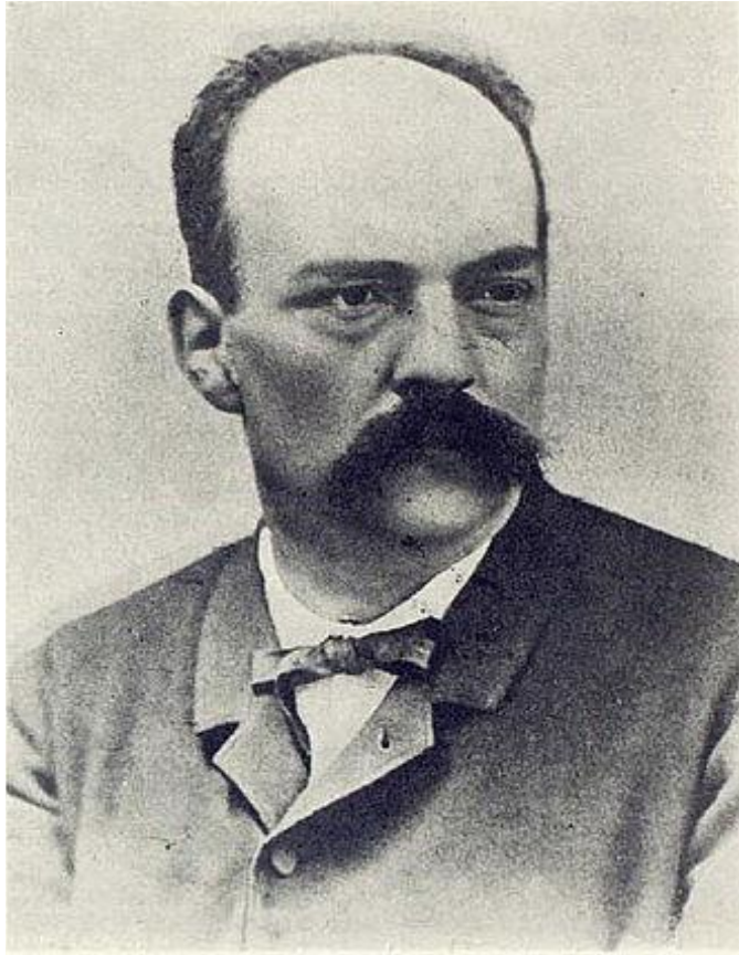
Figura N°4. Valentí Almirall , considerado como el fundador del catalanismo político .

https://www.google.com/search?q=valantin+almiral&tbm=isch&ved=2ahUKEwiP4J7iuKHqAhWtAmMBHY7IDJAQ2-cCegQIABAA&oq=valantin+almiral&gs_lcp=CgNpbWcQAzoHCCMQ6gIQJzoCCAA6BAgAEENQou0zWJfMNGCc0DRoAXAAeASAAZ4CiAGnHJIBBjAuMTcuNJgBAKABAaoBC2d3cy13aXotaW1nsAEH&sclient=img&ei=WvH2Xo_LMK2FjLsPjsuzgAk&bih=608&biw=1366&rlz=1C1NDCM_ftD7821D7821#imorc=4vWhnGMdInOD4M