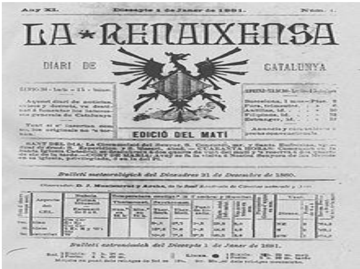
Figura N°5 La Renaixença fue una publicación periódica que apareció en Barcelona el 1 de febrero de 1871 y cuyo último número se publicó el 9 de mayo de 1905.

https://es.wikipedia.org/wiki/La_Renaixensa