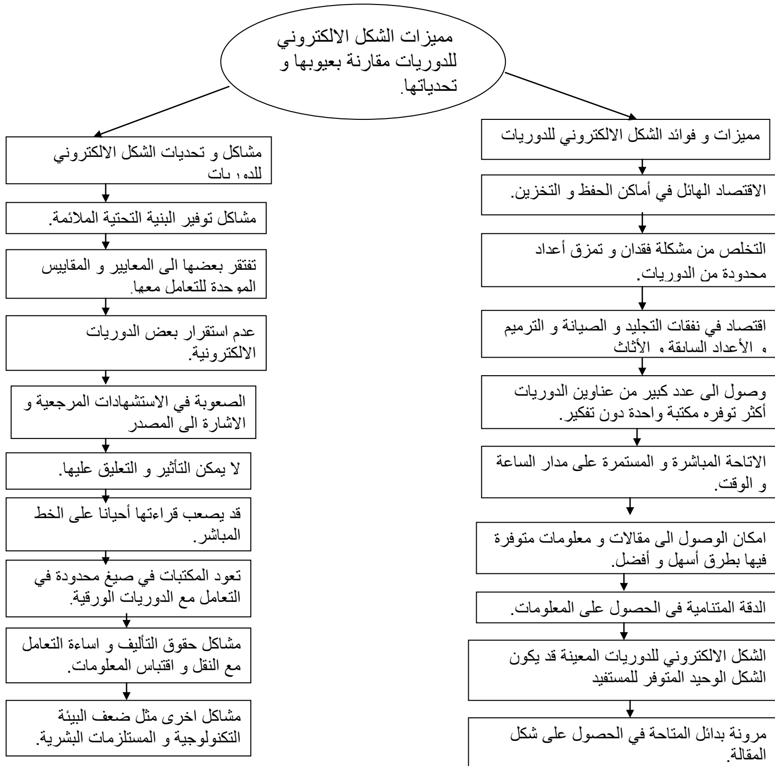
يمثل الشكل 03:مخطط مميزات و عيوب الشكل الالكتروني للدوريات. 1