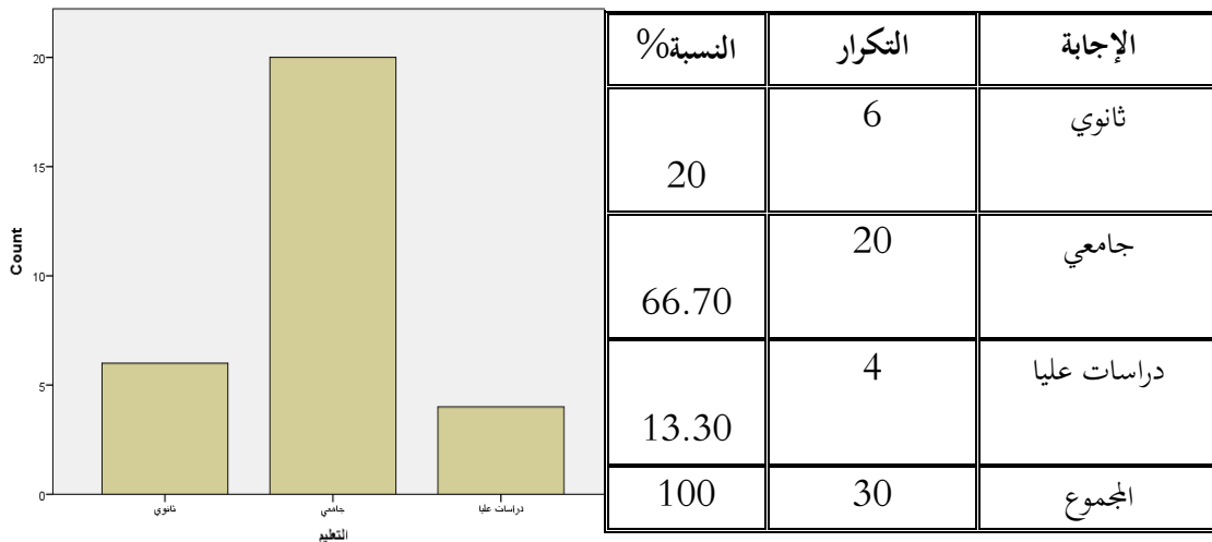
الشكل 3-3 " التمثيل البياني لمستوى التعليمي "