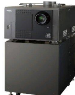
جهاز عرض الفيلم ( Digital cinema projection )