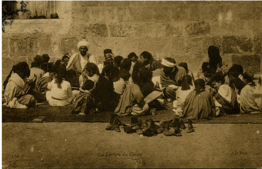
صورة لمقولة تعليمية قرآنية بالزوايا