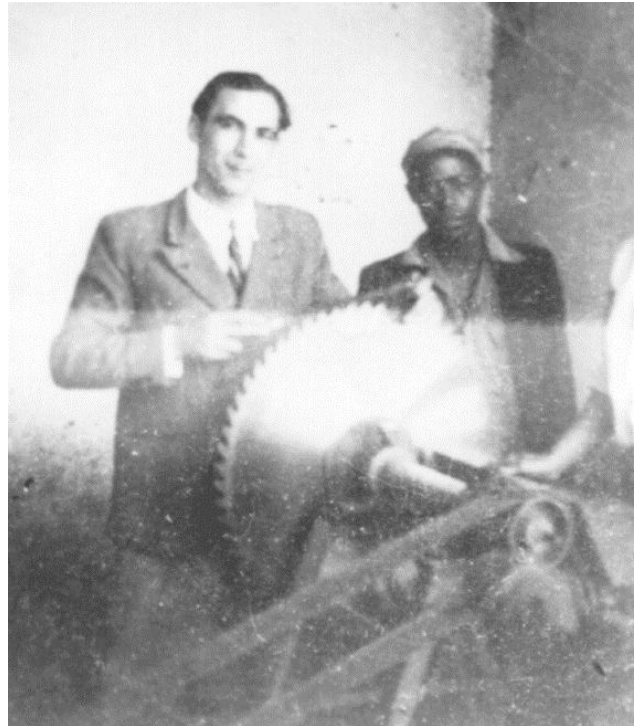
صورة لمقاولة اجتماعية تختص في تكوين الشباب على الميكانيك والنسيج بالزاوية العلوية