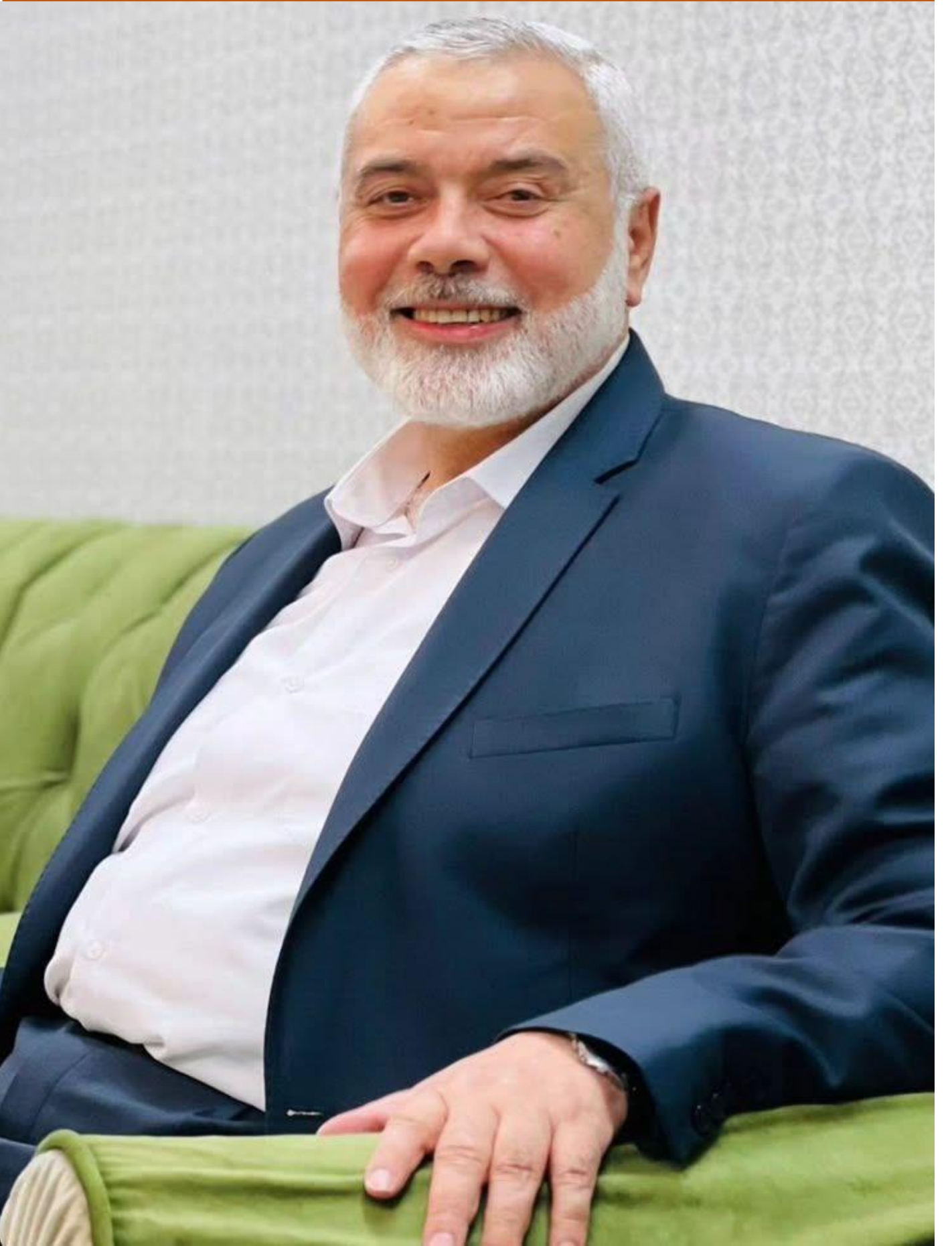
صورة إسماعيل هنية من الأرشيف