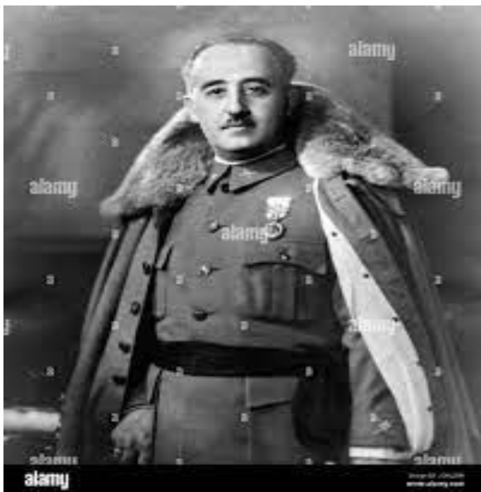
El general Francisco Franco