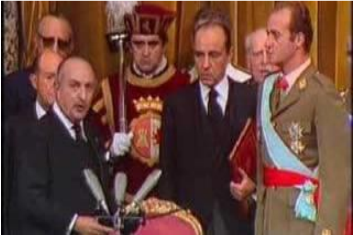
la proclamación de Juan Carlos como rey de España, disponible en http://www.fororeal.net/30aniv.htm