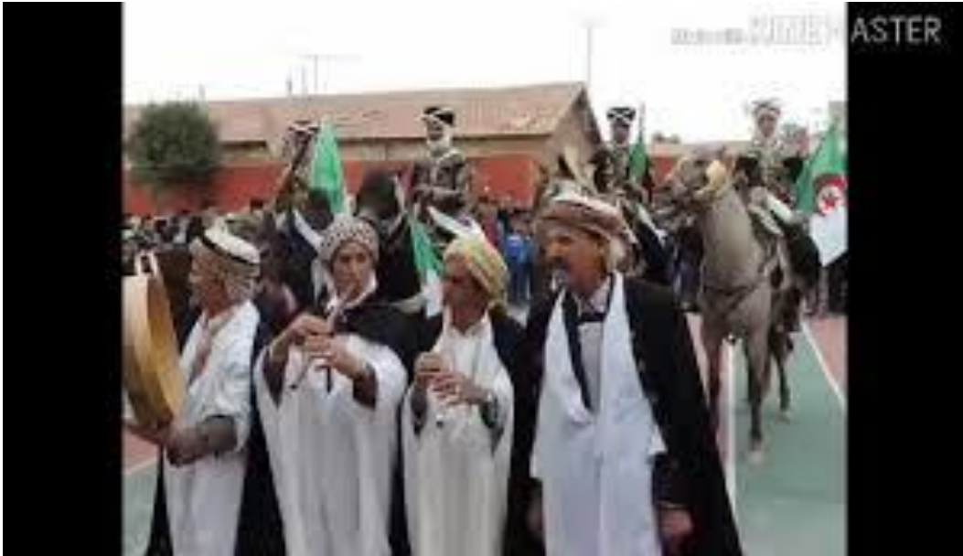
من طبوع الفن الشاوي