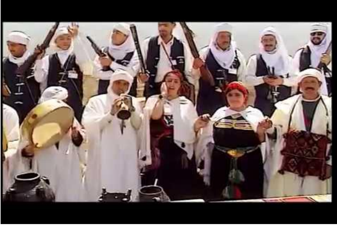
من طبوع الفن والموسيقى الشاوية