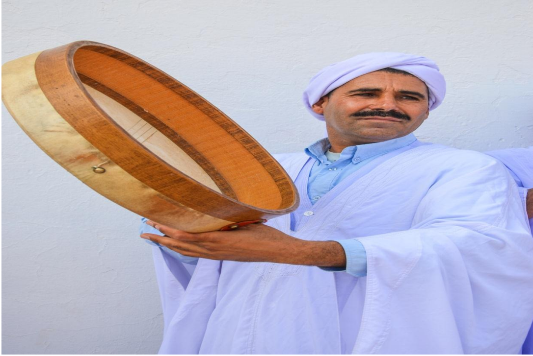
ضارب على آلة البندير في الموسيقى الشاوية