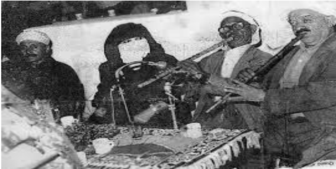
من الفرق القديمة للموسيقى والفن الشاوي