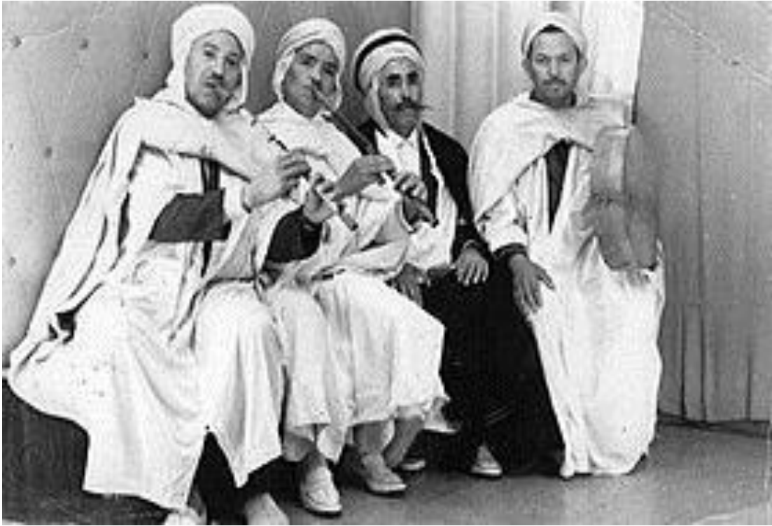
فرقة للفن والموسيقى الشاوي