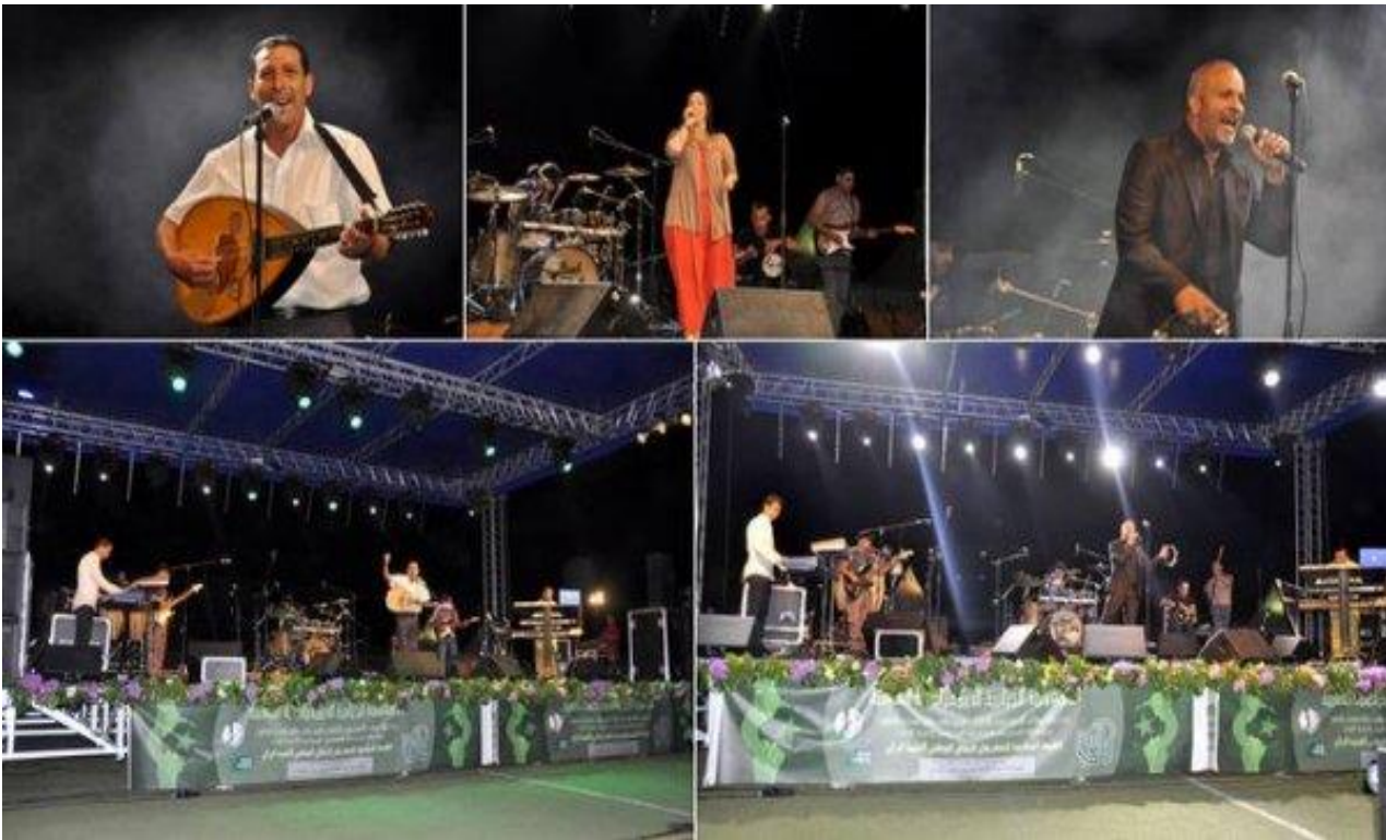
الصورة رقم 13 مهرجان الوطني لأغنية الراي بوهران

8- المهرجان الوطني لأغنية الراي بوهران: يقام سنويا في شهر أوت بمدينة وهران الجزائرية ويضم أكبر موسيقيي الراي المعاصرين.