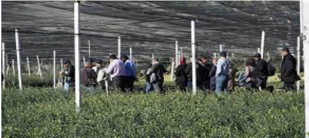
الصورة رقم 06 مهرجان الغذاء و الزراعة

لا توماتينا من بونول - إذا كنت تحب الطماطم ، فهذا هو المهرجان المناسب لك. احتفال مع اختلاف ، La Tomatina هي أكبر معركة للطعام في العالم. كل عام منذ عام 1944 ، كان الناس يتجمعون في شوارع بونول في فالنسيا ، إسبانيا ، لرمي الطماطم الناضجة على بعضهم البعض - فقط لا ترتدي اللون الأبيض.