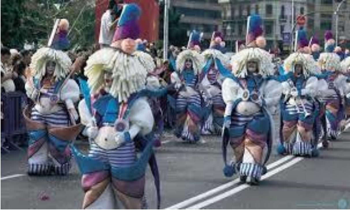
الصورة رقم 02 كرنفالات