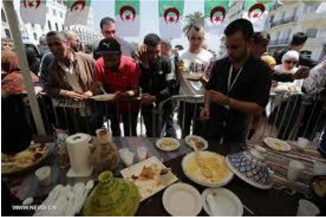
الصورة رقم 10 المهرجان الدولي للكسكسي بالجزائر.

5- مهرجان عنابة للفيلم المتوسط: هو مهرجان سينمائي دولي يشارك فيه معظم بلدان البحر