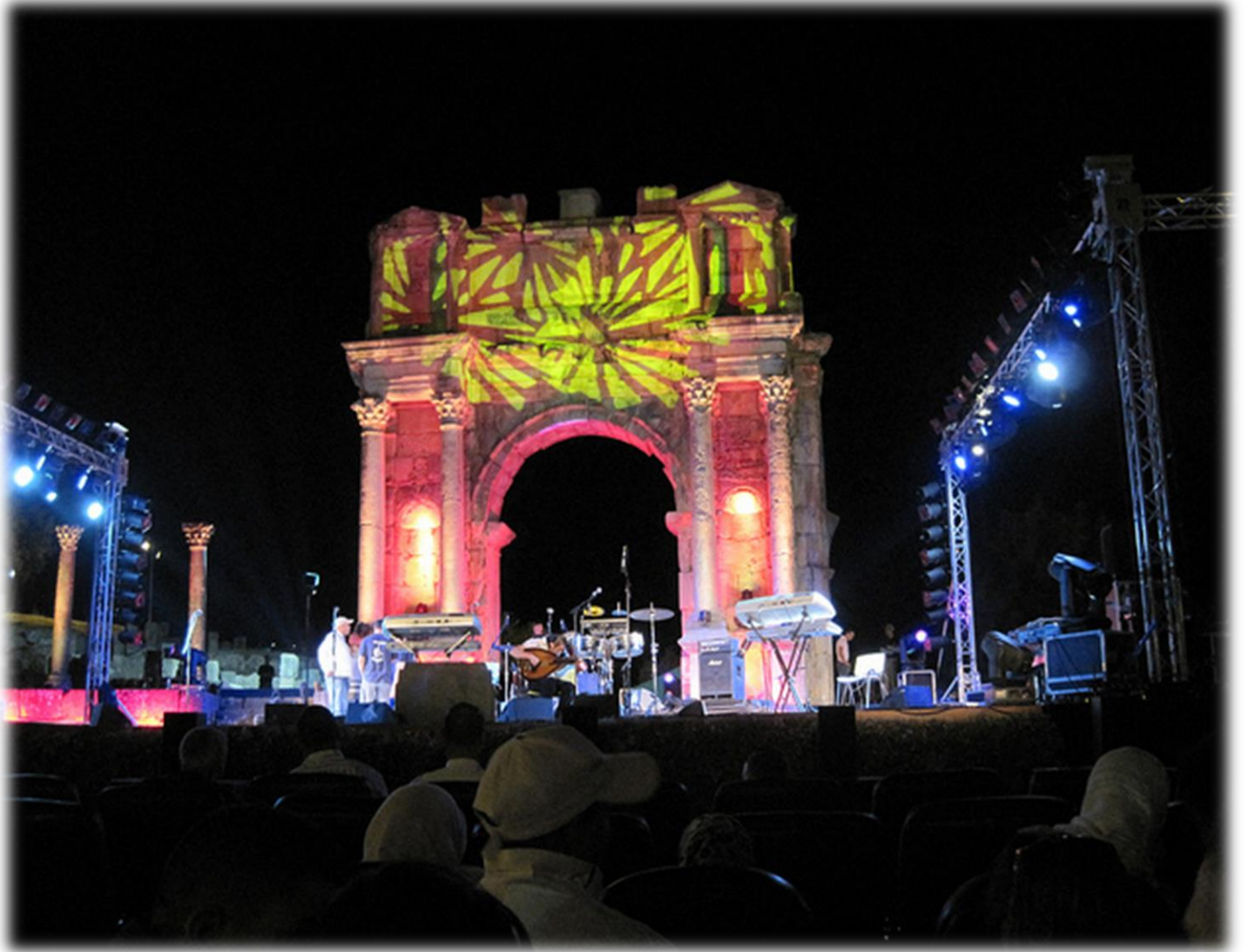
الصورة رقم 17 مسرح تيمقاد