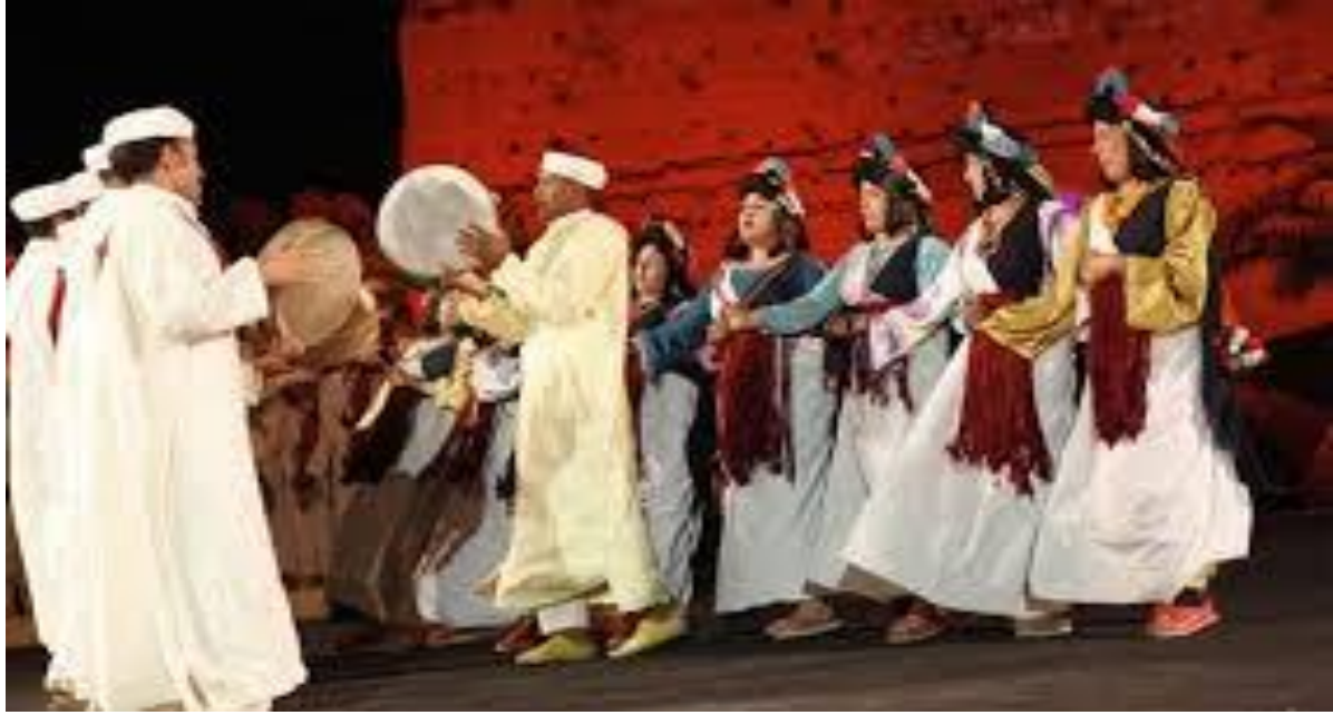
الصورة رقم 03 مهرجانات ثقافية