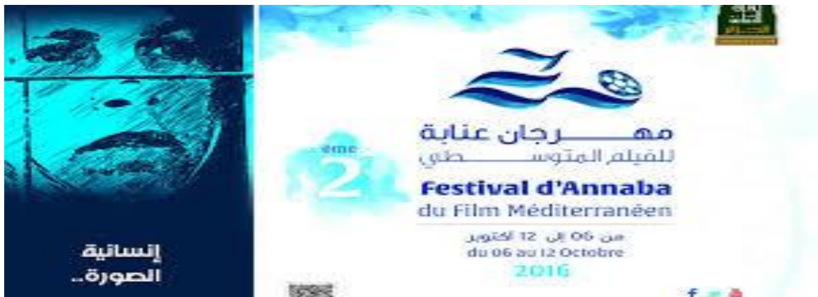
الصورة رقم 11 مهرجان عنابة الوطني للفيلم المتوسط