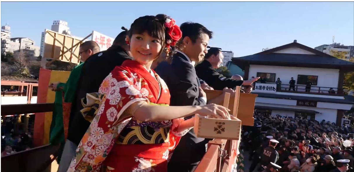
الصورة رقم 04 مهرجان تغيير الفصول

ليس من قبيل المصادفة أن بعض أقدم المهرجانات على وجه الأرض تتزامن مع مواسم معينة البلدان في جميع أنحاء العالم لديها الكثير من المهرجانات التي تنبض بالحياة في فصل الشتاء - والذي يمكن أن يلوم أسلافنا على رغبتهم في الاحتفال خلال أكثر أيام السنة برودة وحلًا، نحتاج جميعًا إلى شيء ما لننتهج أنفسنا ونخرجنا خلال أيام الشتاء القادمة.