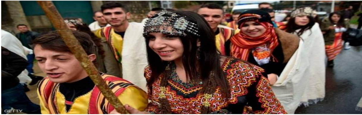
الصورة رقم 08 مهرجان تيفردود في منطقة القبائل.

يعتبر هذا المهرجان، أحد أبرز المهرجانات الارتجالية في الجزائر، وقد تم إطلاقه سنة 2003، في قرية تيفردود الواقعة في بلدة إفارونين بولاية تيزي وزو شرق الجزائر، هذا المهرجان شمل بالأساس الأعمال الفنية والموسيقى بهدف بث الحياة إلى منطقة القبائل التي عانت من أعمال العنف خلال الحرب الأهلية التي دارت رحاها في التسعينيات، وفق القائمين عليه، حيث قتلت الحرب نحو 200 ألف شخص في أنحاء البلاد. وخلال هذه الدورة التي انتهت فعاليتها أمس، تم التطرق لعديد من المواضيع المتعلقة بالحياة الاجتماعية وأساليب البناء التقليدي في المجتمع الجزائري، خاصة في منطقة القبائل التي يسكنها بشكل أساسي الأمازيغ، ويجذب المهرجان سنويًا آلاف الزوار من منطقة القبائل وغيرها من المناطق في الجزائر ومن خارجها أيضًا فهو يستقبل الآلاف من السياح الأجانب. 1