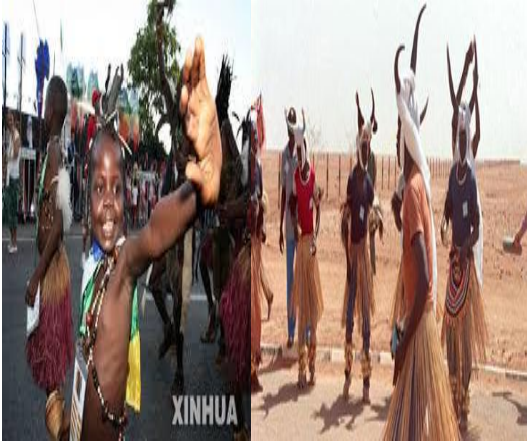
الصورة رقم 15 مهرجان الثقافي الأفريقي الثاني

بالتكفل بنقل الفرق"، وستقام الفعاليات في القاعات وفي الهواء الطلق في الجزائر العاصمة وبومرداس والبليدة وتيبازة وغيرها من مدن شرق البلاد وغيرها 1 .