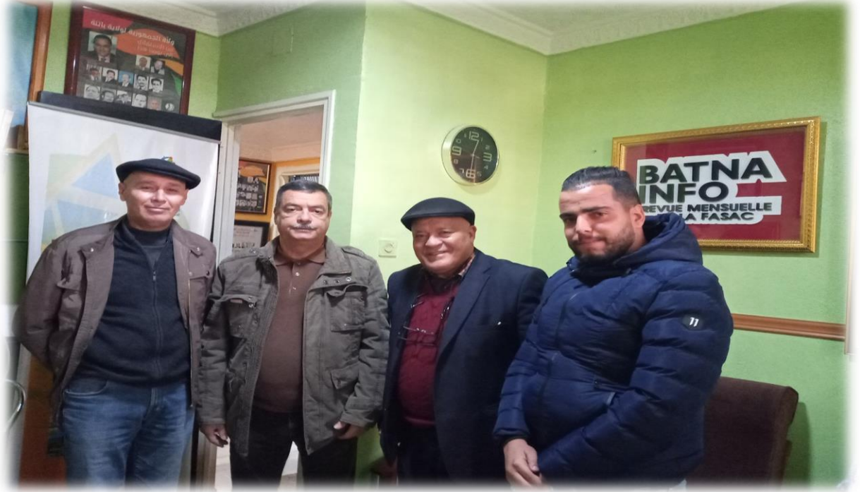
الصورة رقم 18 لقاء مع احباب المهرجان