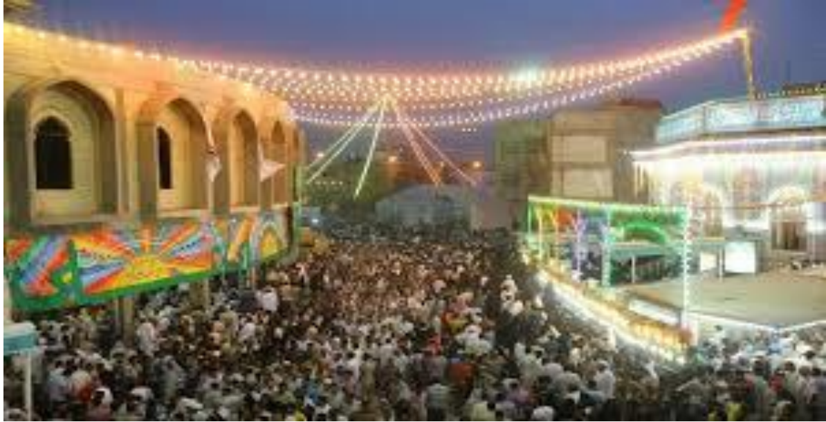
الصورة رقم 01 مهرجان هولوي في الهند