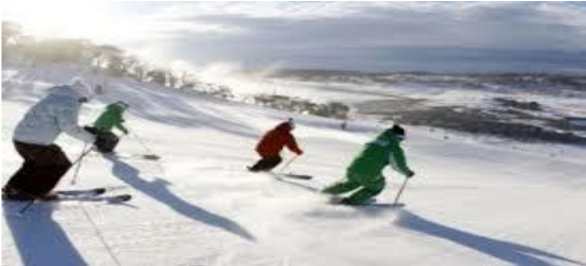
الصورة رقم 05 مهرجان شتاء زحل

الربيع - نحن تقليدياً نحب أيضاً الاحتفال ببدء هذا الموسم. تعود مهرجانات الربيع مثل مهرجان Gaelic Beltane و احتفالات عيد العمال إلى قرون. عندما تنفتح أزهار جديدة ، تولد الحملان في الحقول ، وتنمو الأيام لفترة أطول وتزداد درجة الحرارة دفئاً ، نريد أن نحتفل. تركز المهرجانات حول هذا الوقت عادة على الحياة الجديدة والأمل في المستقبل ، مع الرقص والغناء والفواكه والخضروات التي دخلت الموسم للتو 1 .