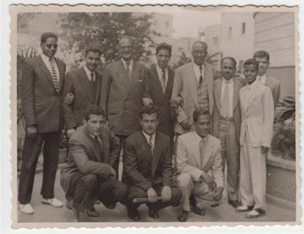
محمود شاكر - ومالك بن نبي - وآخرون