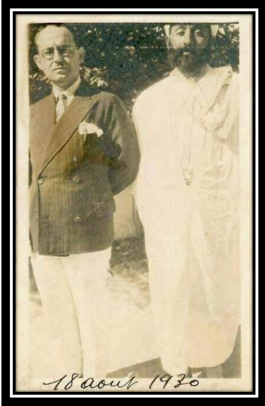
مالك بن نبي وعبد الحميد بن باديس