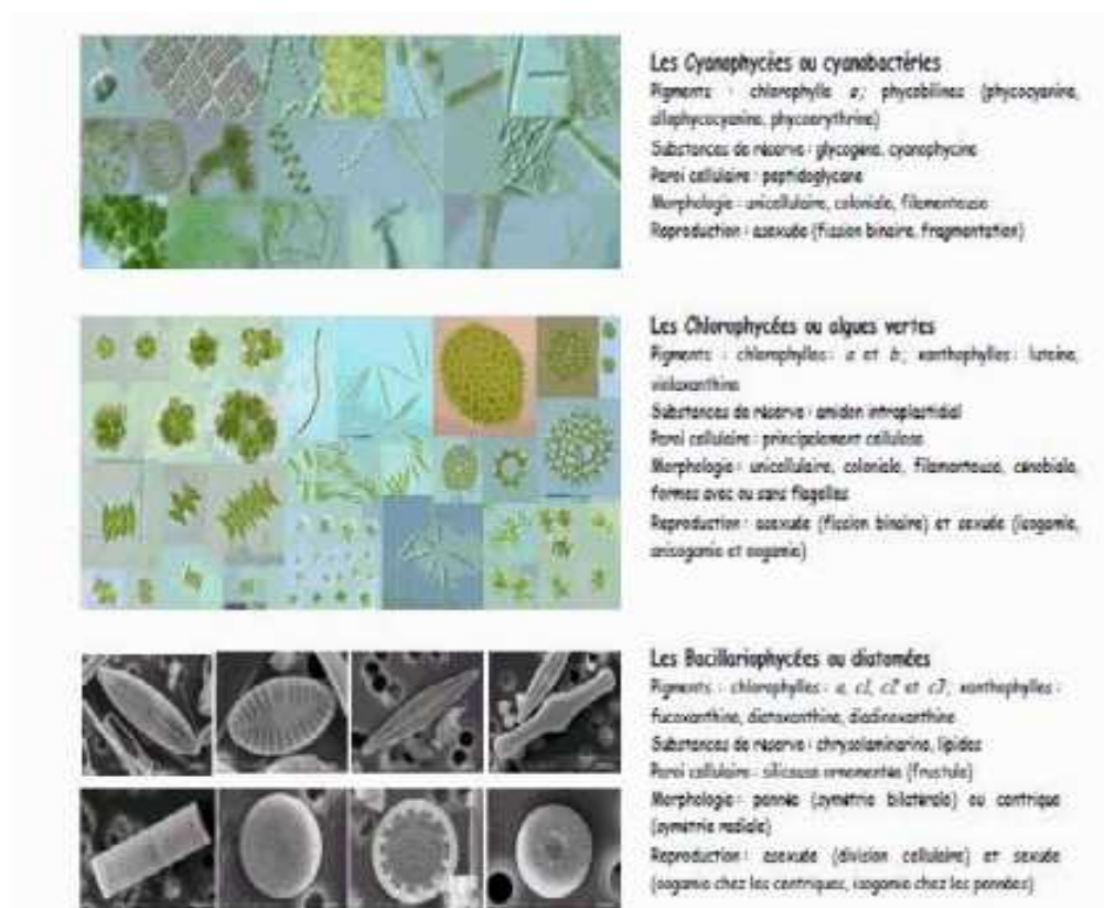
Figure 1 : Les cyanophycées, les chlorophycées et les diatomées (GROGA, 2012)

Les diatomées engloberaient plus de 100 000 espèces et on estime que seulement près de 15000 ont été identifiées à ce jour. C'est un des groupes les plus importants du phytoplancton (GROGA, 2012) comme illustré en « figure 1 ». Elles contribuent largement à la fixation du dioxyde du carbone atmosphérique et donc au cycle du carbone, ainsi qu'au cycle du silicium (LANGLOIS, 2006). Leur caractéristique principale est la présence d'une paroi cellulaire siliceuse appelée frustules. La reproduction végétative par division cellulaire est le mode le plus commun de leur multiplication (GROGA, 2012).