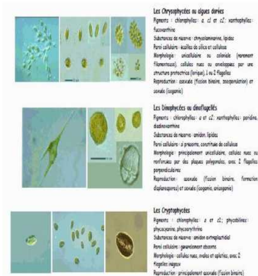
Figure 2 : Les chrysophycées, les dinophycées et les cryptophycées (GROGA, 2012)

* Les chrysophycées sont des algues unicellulaires jaunes à brunes, de forme allongée et de petite taille (2 à 3 microns). Elles vivent indépendantes ou en colonies (MOLLO et NOURY, 2013). Très bien représentées en eaux continentales, plus au moins fixées sur des substrats divers (DUSSART, 1992) illustré en « figure 2 ».