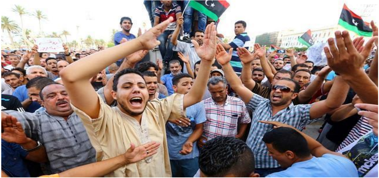
Manifestación en Trípoli pidiendo una intervención armada internacional que proteja a los civiles (2014)