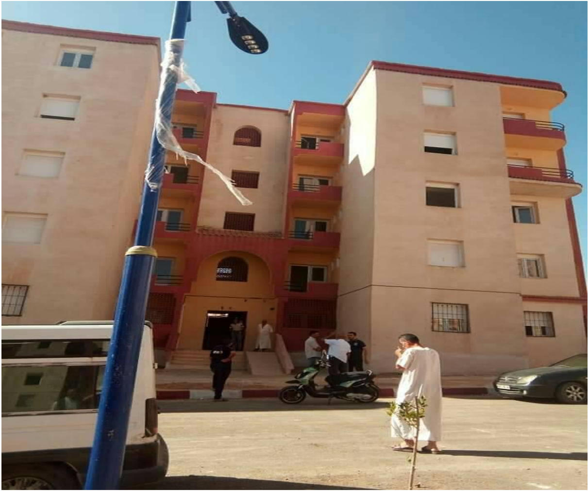
مدخل عمارة حي أحمد بن بلة