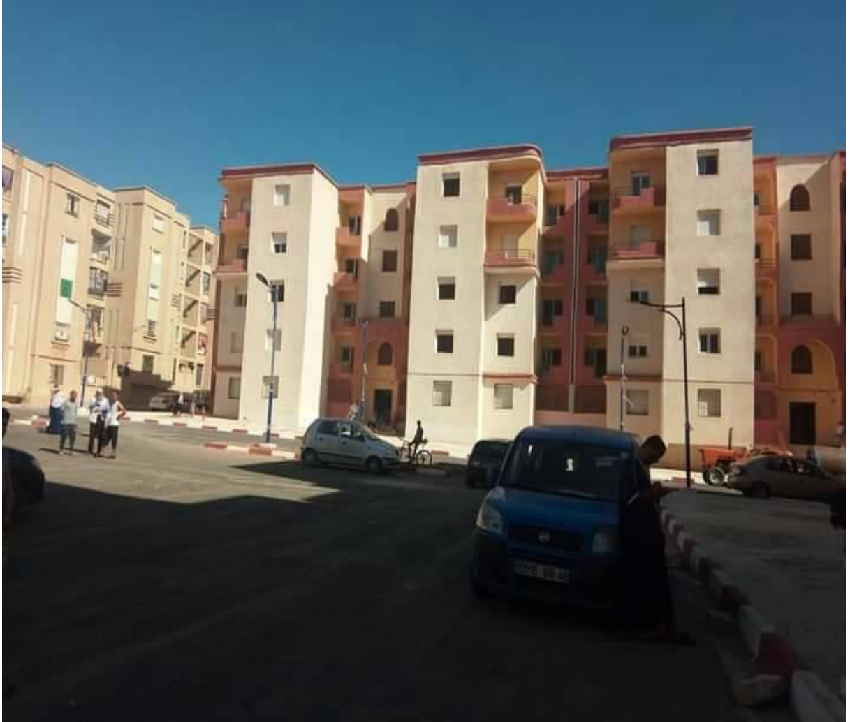
عمارة حي أحمد بن بلة