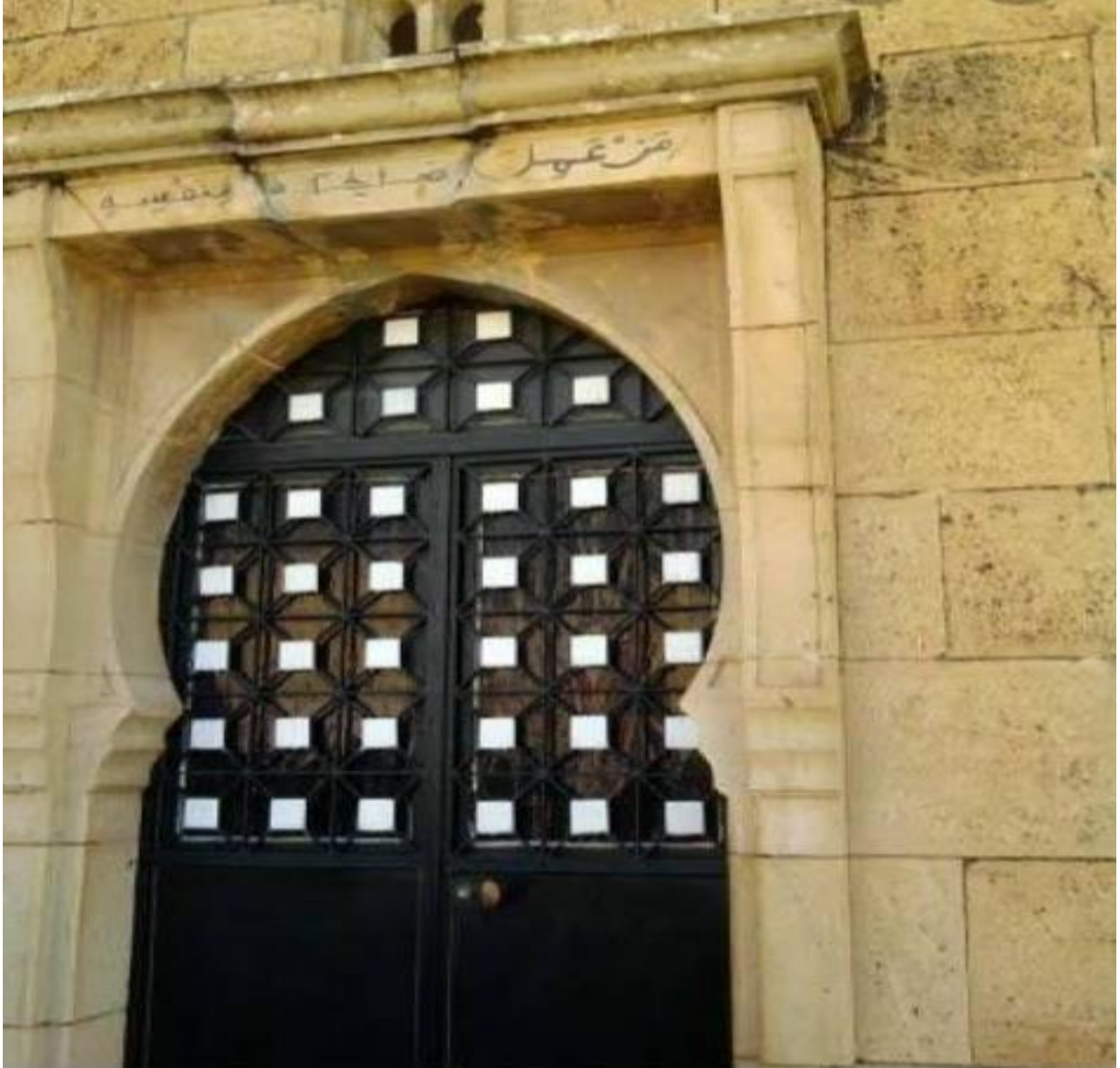
جامع مازونة قديما في القصبة