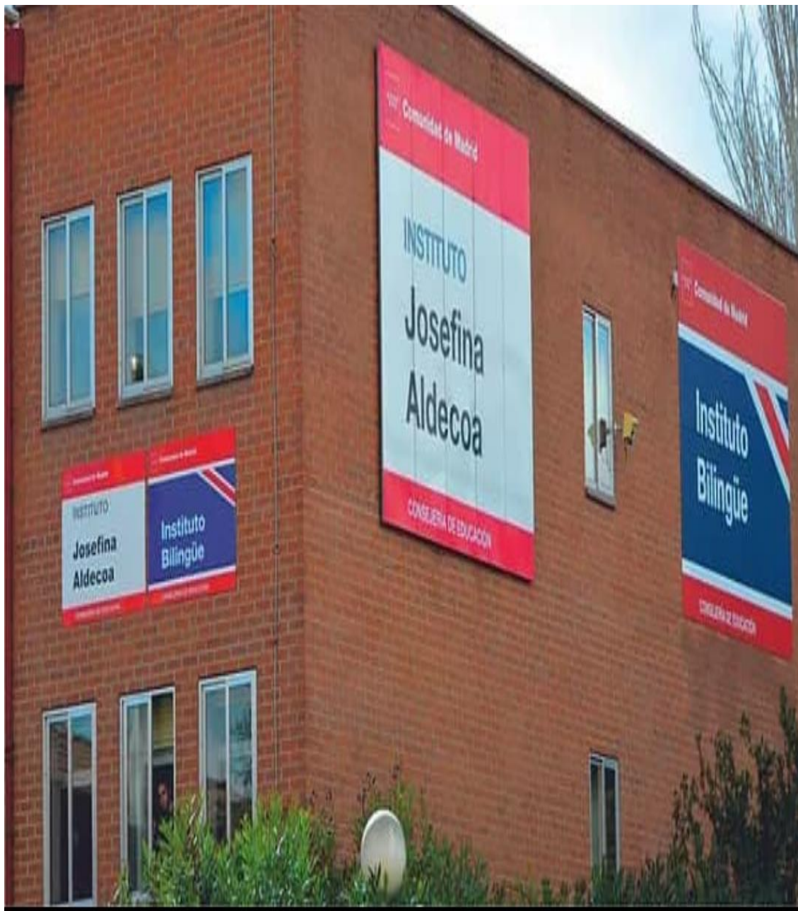
Anexo 7: Colegio Estilo de la autora Joséfina Aldecoa en Madrid.

Disponible en https://images.app.goo.gl/oDSsApprqb5NTvRP8