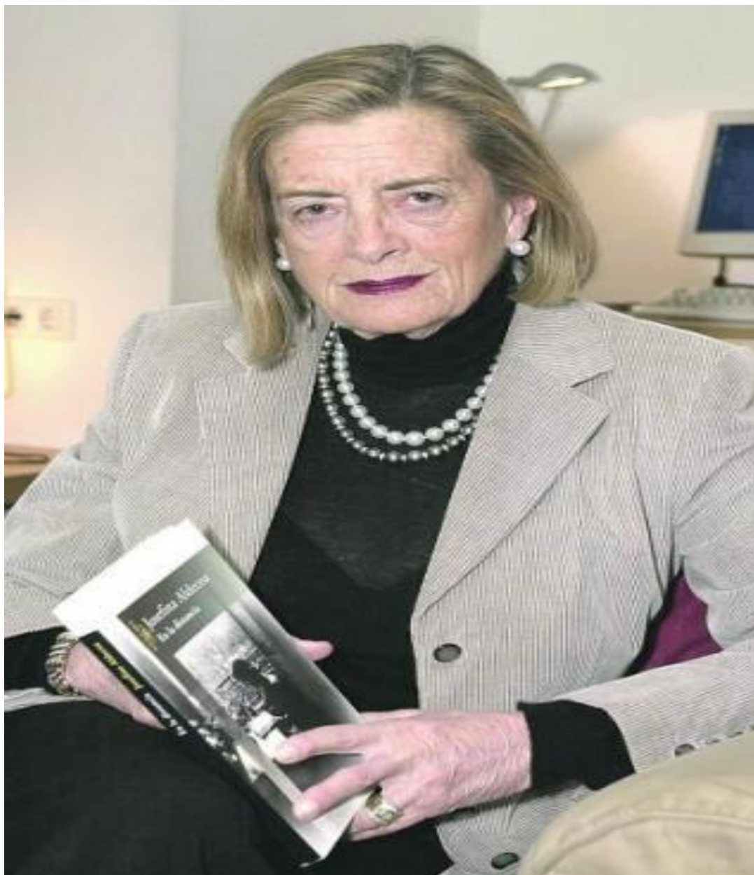
Anexo 3: El autora Joséfina Aldecoa.

Disponible en https://images.app.goo.gl/TMewypKUVHAEgLn8