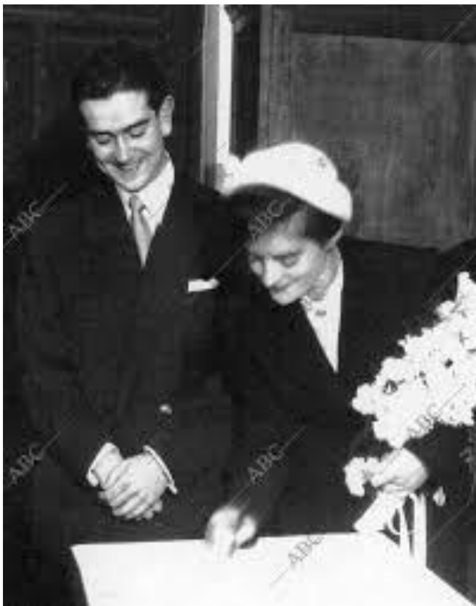
Anexo 5: Joséfina con su marido el escritor Ignacio Aldecoa.