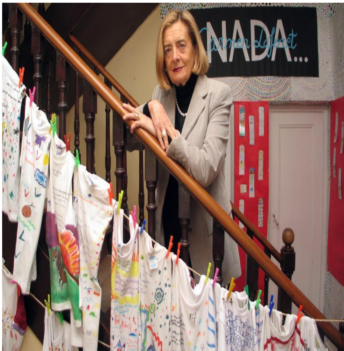
Anexo 8: Joséfina Aldecoa.