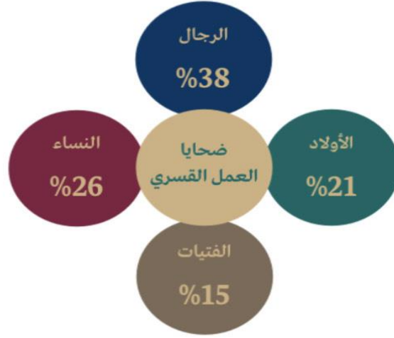
الشكل (2): ضحايا العمل القسري