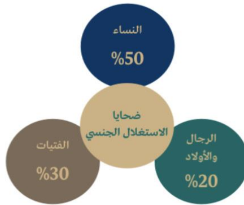
الشكل (1): ضحايا الاستغلال الجنسي

تعد عبارة "الاستغلال الجنسي" محل تفسيرات مختلفة، وذلك راجع لعدم تعريفها في إطار بروتوكول منع وقمع اتجار بالأشخاص، وخاصة النساء والأطفال، ولكن من مستجدات قانون 04/23 أن المشروع الجزائري عرف الاستغلال الجنسي وحدد صورته، في الفقرة الرابعة من المادة الثانية على أن الاستغلال الجنسي هو استغلال شخص ما بهدف الحصول على مزايا منه مهما كانت طبيعتها في تعاطي الدعارة أو أي نوع من الخدمات الجنسية، وخاصة استغلاله في مشاهد استغلال أو مواد إباحية من خلال إنتاج وتوزيع تلك المشاهد أو المواد الإباحية. 1