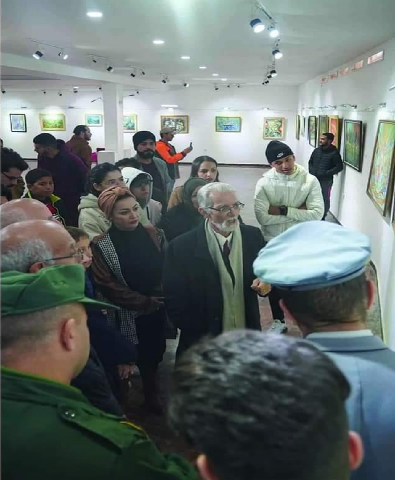
صورة من أجواء المعرض