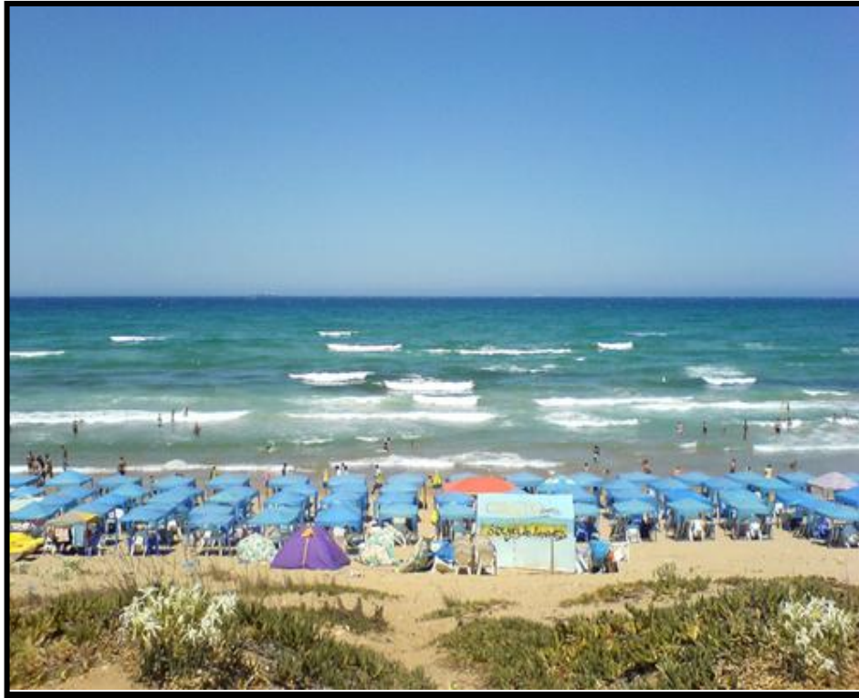
Photo : Les salettes plage

Les touristes : Voici le résultat du questionnaire posé à 41 personnes