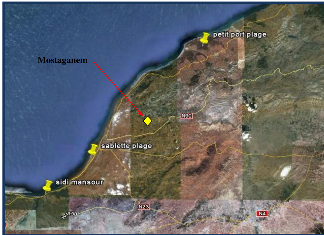
Carte 8.4 : situation des plages retenues pour l'enquête.

Pour les entretiens ils ont été effectués dans les bureaux des responsables comme la directrice de la culture, la directrice du tourisme, un représentant de la protection civile, un représentant de l'association civile (le renouveau), les agences de voyage.