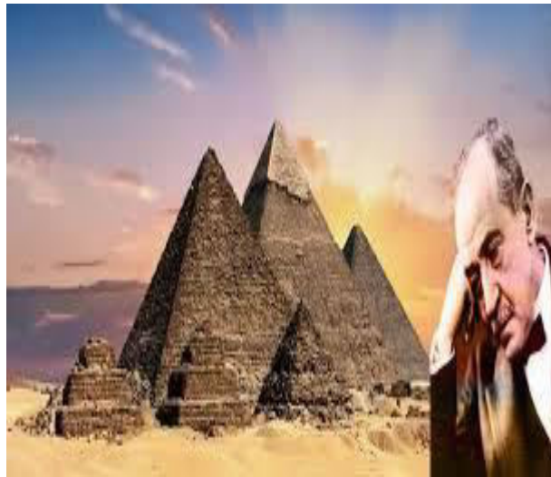
Anexo 3: foto de Ahmed Shawki.