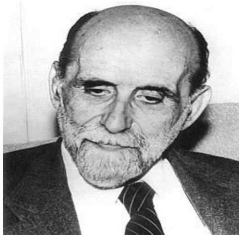
Anexo 1 : Foto de Juan Ramon Jimenez.