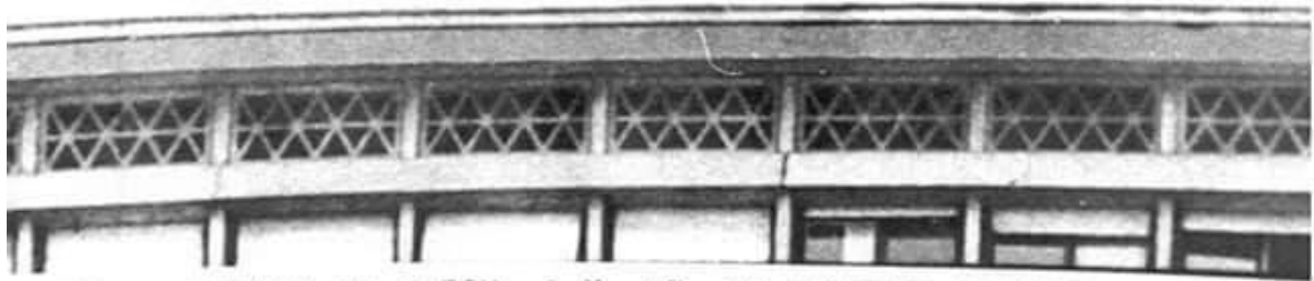
ALGER : DEPUIS CE MATIN, 9 H. 17, LE DRAPEAU ALGERIEN FLOTTA