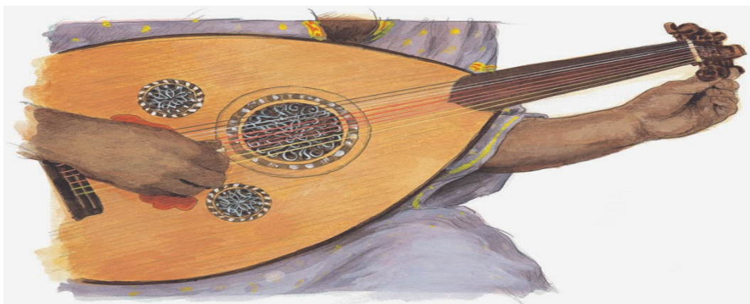
Imagen 1: El laúd con la modificación de Ziryab

Ziryab utiliza la pluma de águila para jugar el laúd en lugar de la madera para que el sonido sea más dulce, prefiero la pluma porque le dio un sonido más agradable, mientras que la madera daño el laúd con el tiempo.