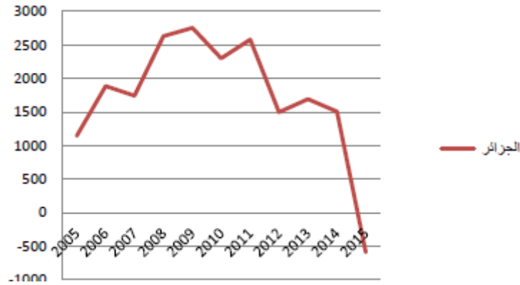
الشكل 2: تدفق الإستثمار الأجنبي المباشر الوارد الى الجزائر

كان تدفق الإستثمار الأجنبي المباشر الوارد الى الجزائر في الفترة 2005-2015 كما هو موضح في الشكل الموالي: