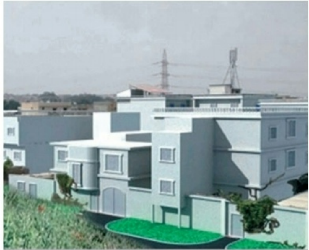
... ترقية إطار مبني ذي مظهر جمالي ومهيأ بانسجام.

احترام المظهر الجمالي للبناء أصبح يحظى بحماية القانون. تنص المادة 12 من القانون صراحة على أن: "المظهر الجمالي للإطار المبني يعتبر من الصالح العام". وعلى هذا السبيل فقد أصبح إلزاميا أمر المحافظة عليه وترقيته.