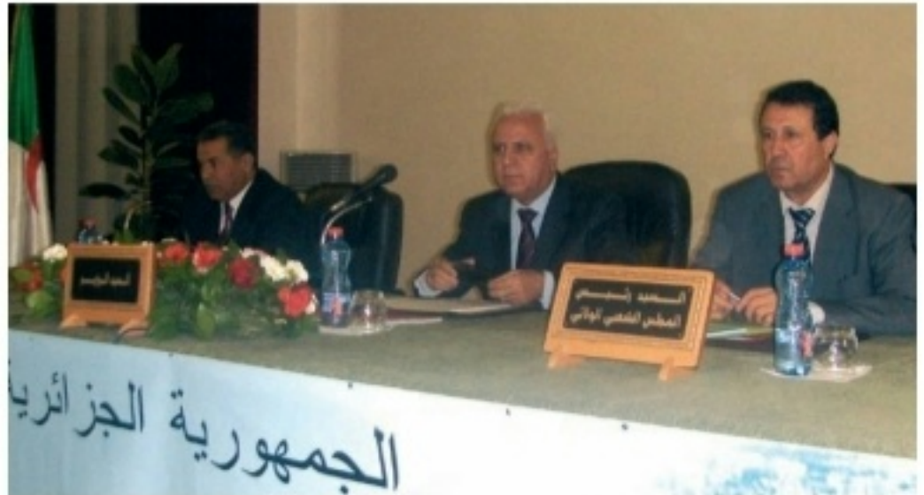
نظمت عدة تجمعات جهوية من طرف القطاع.

أمام المسؤولين التقنيين للعمارة، البناء والسكن، وإطارات الإدارة الإقليمية وكافة المنتخبين المحليين، دعا السيد موسى أيضا إلى ترقية المظهر الجمالي إلى مستوى الصالح العام. لقد تمنى في هذا السياق أن ترقى المدن الجزائرية إلى مستوى المدن الكبرى الواقعة في محيط البحر المتوسط.