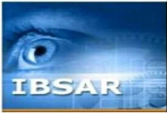
الشكل 05: برنامج إِبصار