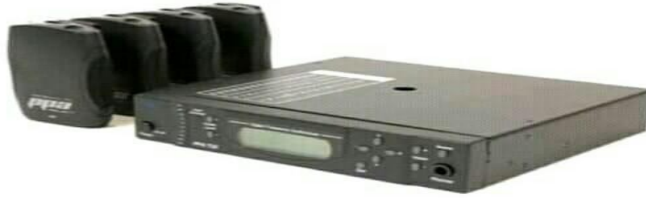
الشكل 02: جهاز الدوائر السمعية