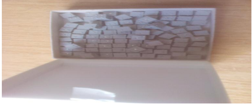
الشكل 13: مكعبات للحساب بالبرائل