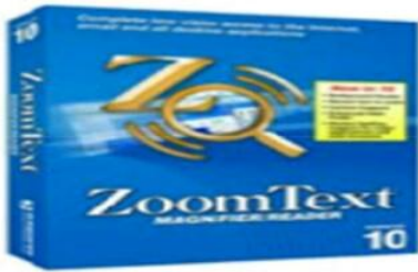
الشكل 08: برنامج زوم تاكست