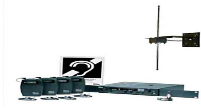
الشكل 01: أجهزة الإرسال بالذبذبات المعدلة