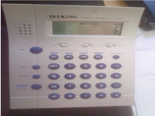
الشكل 14: آلة حاسبة ناطقة

الملحق رقم 02: الأجهزة و البرامج المساعدة