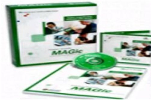
الشكل 09 : برنامج ماجيك

الملحق رقم 02: الأجهزة و البرامج المساعدة