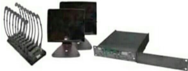
الشكل 03: نظام INFRARED SYSTEM

الملحق رقم 02: الأجهزة و البرامج المساعدة