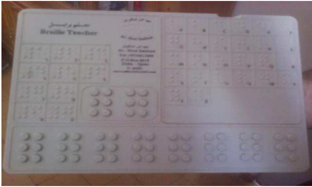
الشكل 11: صورة معلم البرaille