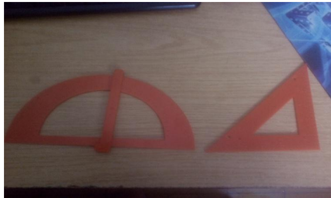
الشكل 12: منقلة و كوس بالبرaille

الملحق رقم 02: الأجهزة و البرامج المساعدة