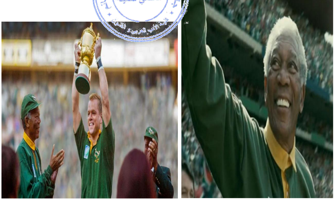
Invictus (2009) 1

فيلم Invictus (2009) من إخراج كلينت إيستوود، يروي قصة مستوحاة من أحداث حقيقية حول نيلسون مانديلا (مورغان فريمان) وسعيه لتوحيد جنوب إفريقيا بعد الفصل العنصري من خلال دعم فريق الرجبي الوطني. يعتمد الفيلم على الجمال الفني والدور الذي لنقل رسالته الإنسانية العميقة.