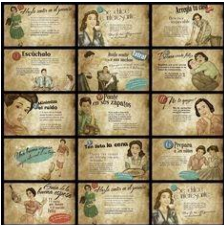
Las reglas de la buena esposa , disponible https://www.pinterest.it/marta6666/las-mujeres-durante-el-franquismo/