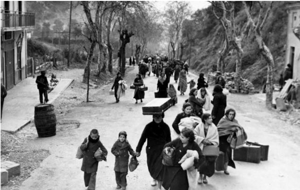
El exilio de las mujeres, disponible en https://www.larioja.com/culturas/exilio-republicano-nunca-20200228000621-ntvo.html