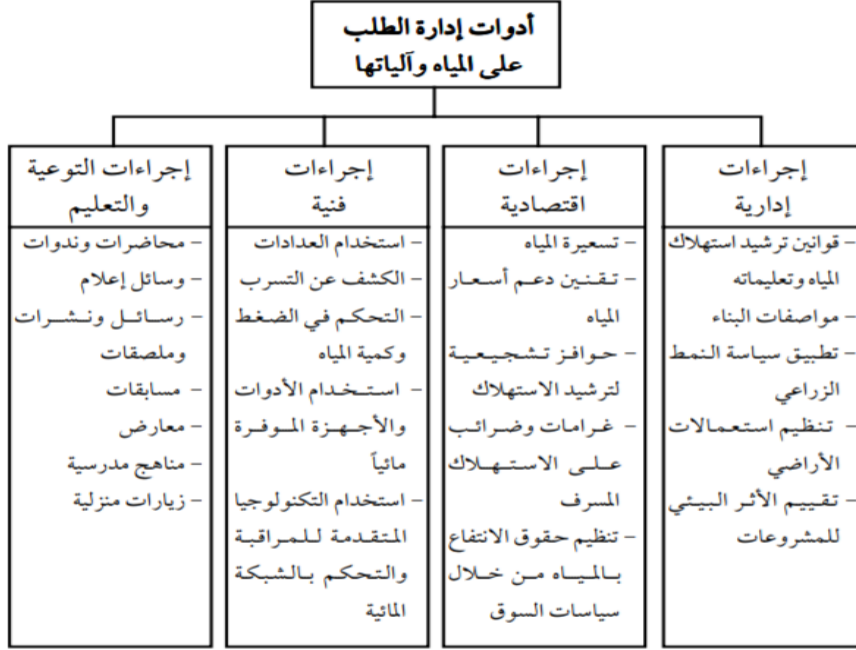
الشكل 2: أدوات إدارة الطلب على المياه وأدواتها