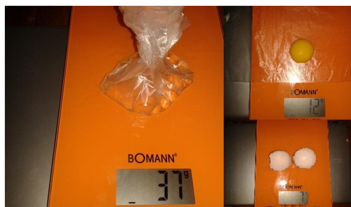
Figure 7: poids des composants de l'œuf