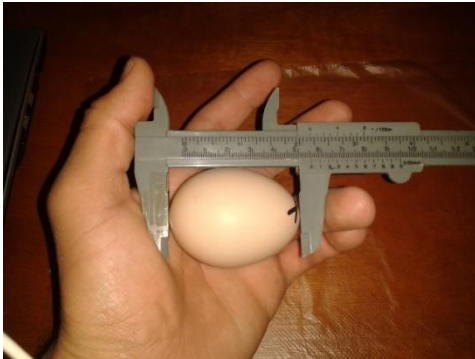
Figure 6: mesure de la longueur