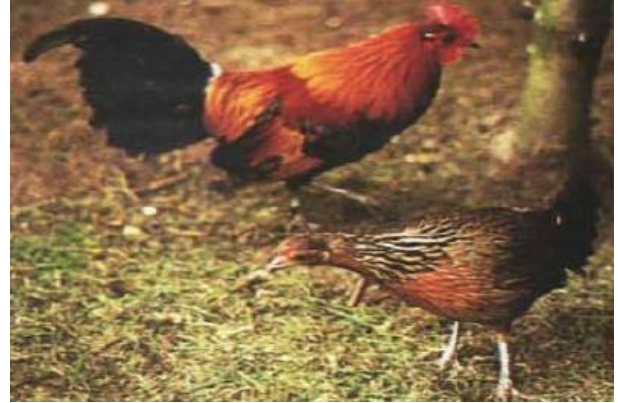
Figure 3: Gallus gallus (Coquerelle2000)

L'introduction des poules en Afrique n'est pas très documentée alors que sa production prend racine des pratiques traditionnelles anciennes. Elle constitue l'espèce domestique la plus élevée en Afrique car les familles gardent chacune un troupeau de 5 à 20 sujets (Guèye 1997-1998).