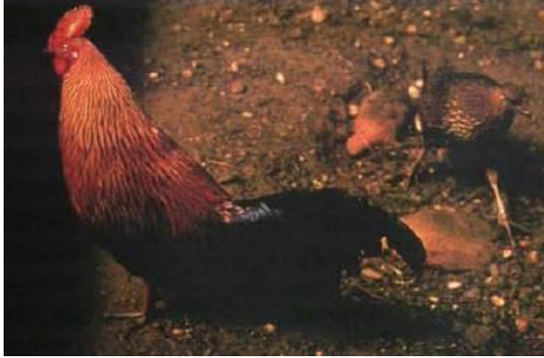
Figure 4: Gallus lafayetti (Coquerelle2000)