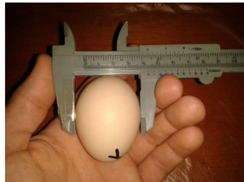
Figure 5: mesure de la largeur