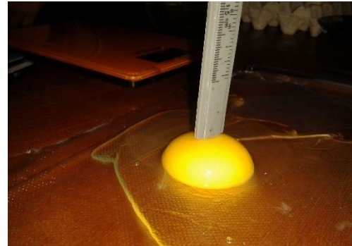
Figure 9: hauteur de jaune de l'œuf