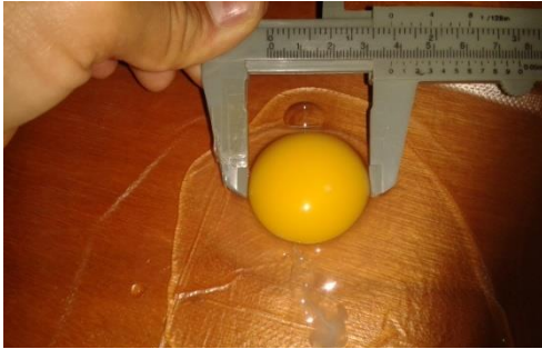
Figure 10: mesure de la largeur du jaune d'œuf