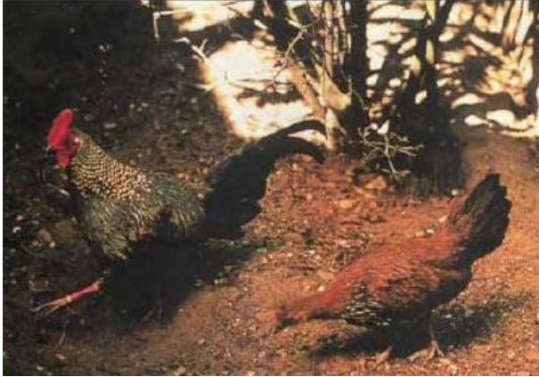
Figure 1: Gallus sonneratii (Coquerelle2000)

- Gallus sonneratii : (Fig2) nommé aussi coq gris, à plumage rappelant un peu l'argenté sur certaines parties du corps, possède des plumes cornées au camail. On le trouve dans le Sud-Ouest du continent indien (en forêt) (Coquerelle 2000)