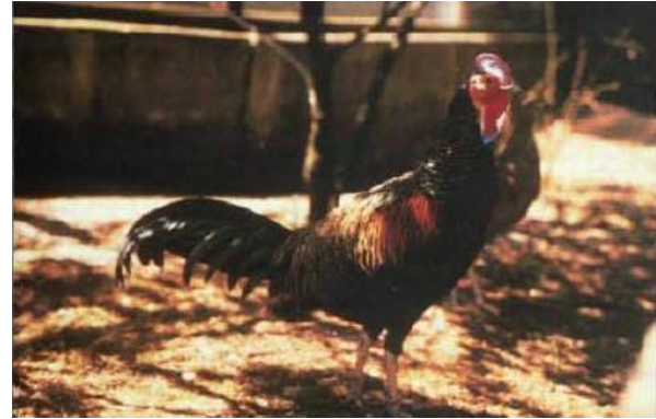
Figure 2: Gallus varius (Coquerelle2000)

- Gallus lafayetti : (Fig4) à la poitrine brun clair orangée avec une tache violette en haut du cou et une tache jaune sur la crête. On le trouve à Ceylan (en zone boisée) (Coquerelle 2000).