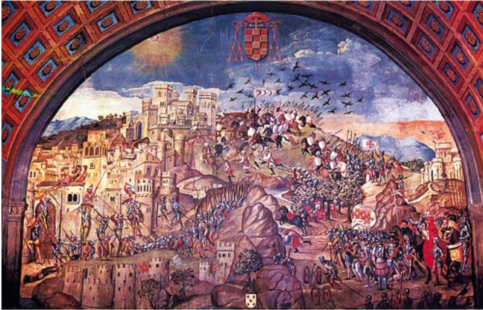
(se trata de la toma de oran por el cardenal Cisneros 1509 durante el proceso de la expansión fernandina ).