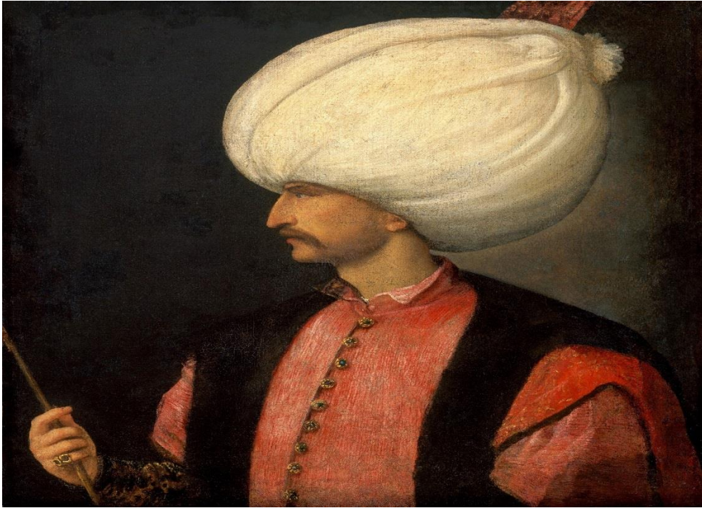
Solimán el Magnífico disponible en ( https://en.m.wikipedia.org/wiki/File:EmperorSuleiman.jpg )