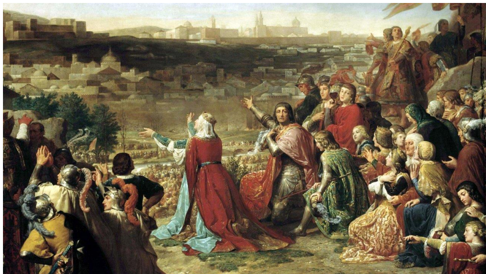
Juan de Borgoña