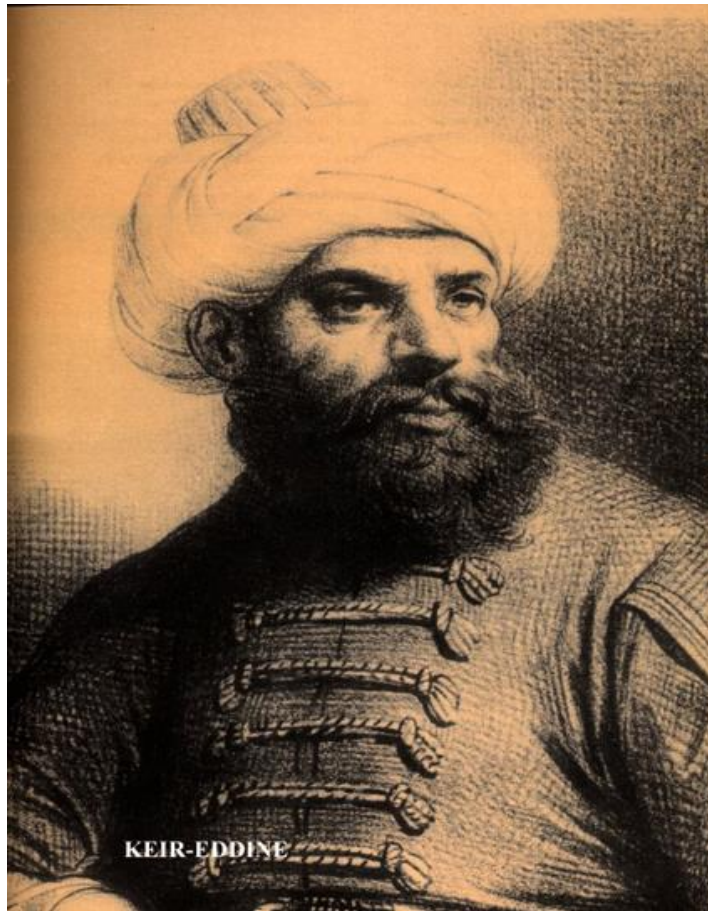
Khayr Al-Din Barbarroja desponible en ( http://algeroisementvotre.free.fr/site0301/barbares/barbe001.html )