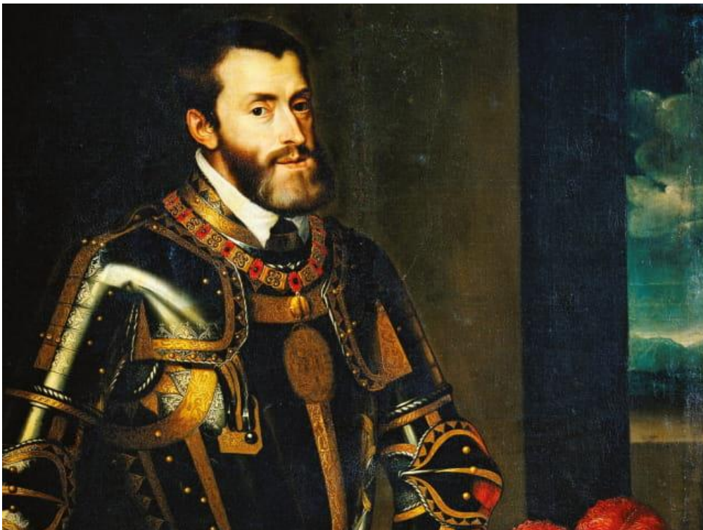
Carlos V disponible en( https://www.saint-pauldevence.com/en/italian-dream-francis-1st/ )