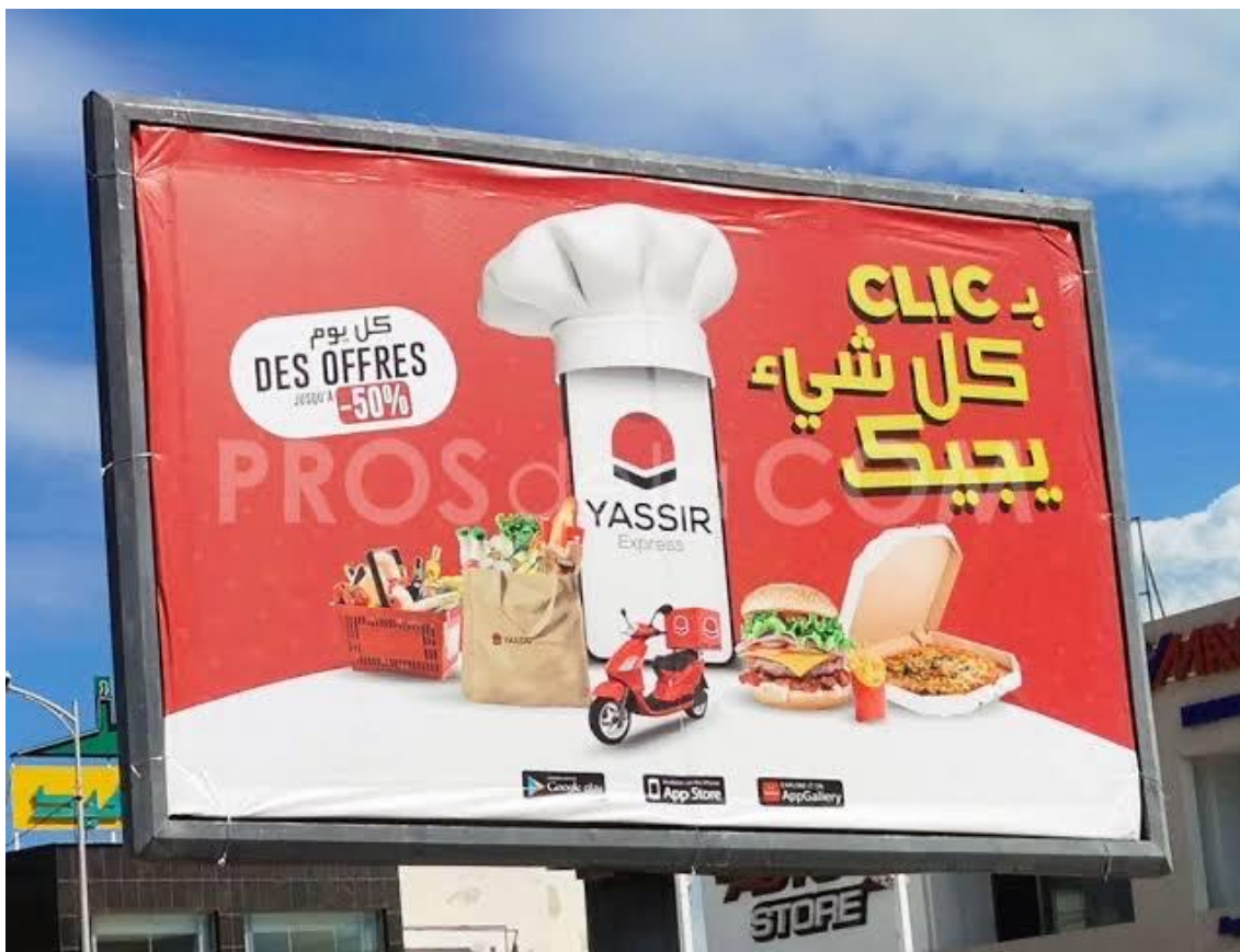
Affiche publicitaire de Yassir