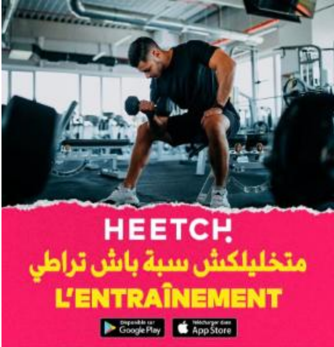
Affiche publicitaire de Heetch 1 :