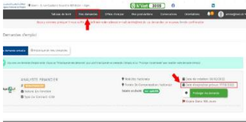
الشكل رقم 03 مراقبة تاريخ نهاية الصلاحية 1

المصدر: موقع الوكالة الوطنية للتشغيل ANEM