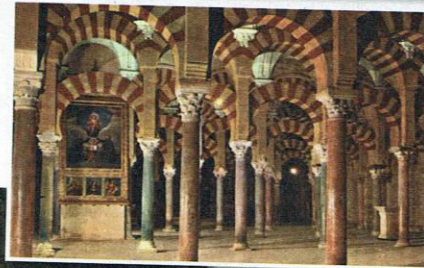
Mezquita de Córdoba