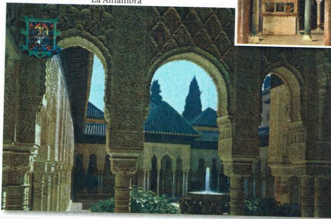
Español 2º as